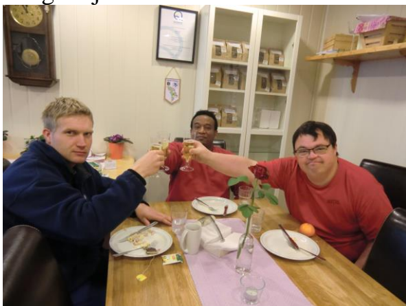
Her feirar me ny Equassgodkjenning.

Equass Assuranse er eit europeisk system for kvalitetssikring av velferdstenester med ekstern revisjon og sertifisering. Den gjer tenestelevrandørar i velferdssektoren moglegheit til å sikra kvaliteten av tenestene overfor brukarar og andre samarbeidspartar. Arbeids- og velferdsdirektoratet har sett krav om kvalitetssikring med ekstern revisjon og sertifisering for å kunna drifta ein del av arbeidsmarknadstiltaka. Aufera har som mange andre vekst og atfføringsverksemdar valt Equass som system. Me vart første gang godkjent i 2011, og må ha ny sertifisering annakvart år. Det er ei omfattande sertifisering som krev mykje av verksemda. Aufera hadde revisjon i november 2017, og er no godkjent fram til 4.desember 2019.