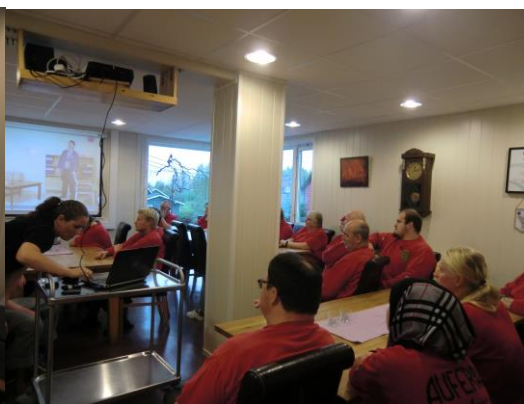
Her er det brannvern teori.