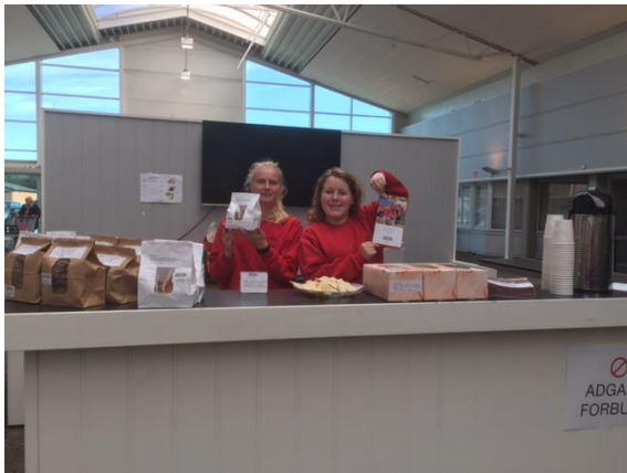
To av våre arbeidarar ute på salsoppdrag.