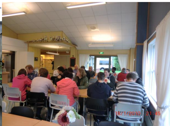
Lydhør forsamling får orientering på KIM