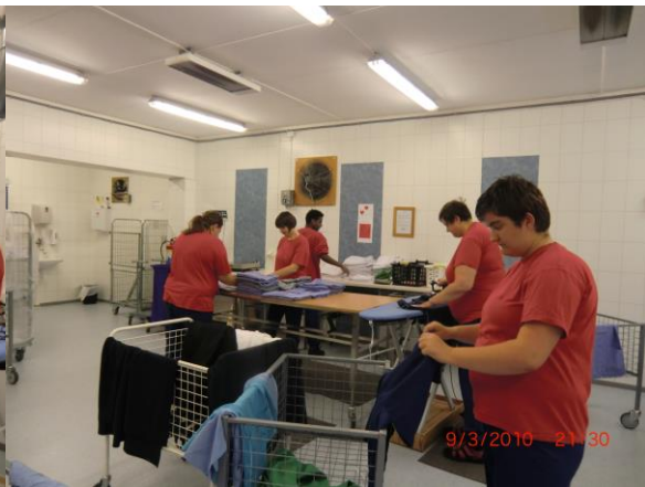
Her er full aktivitet