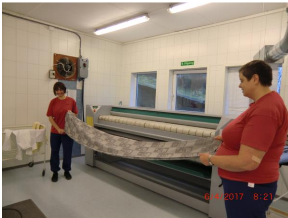
Rulling av dukar