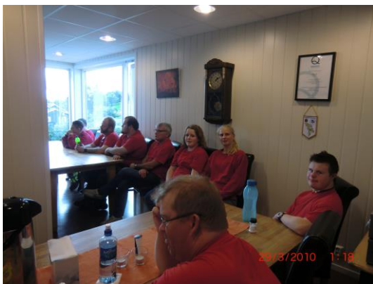
Frå kurs i hygiene.