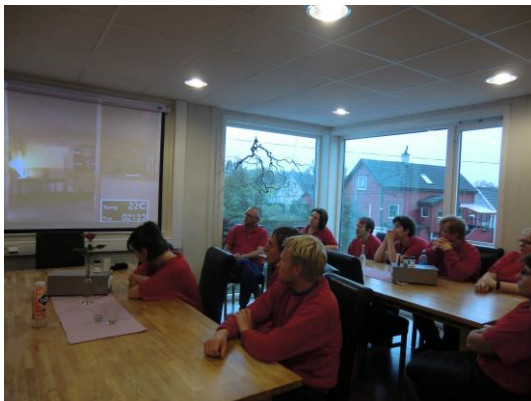
Først teori, og etterpå var det praksis.