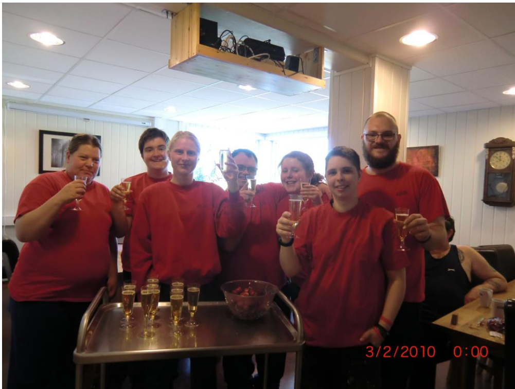
Styrevedtak om huskjøp vart sjølvstaga feira med «sprudlevatn» og jordbær

Me har stor tru på at 2018 vil verta eit spennande år for Aufera og at det vil verta eit år der Aufera enno ein gang kan visa at me får det til.