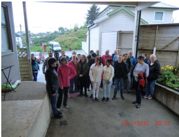
Klar til avreise på Blåtur.