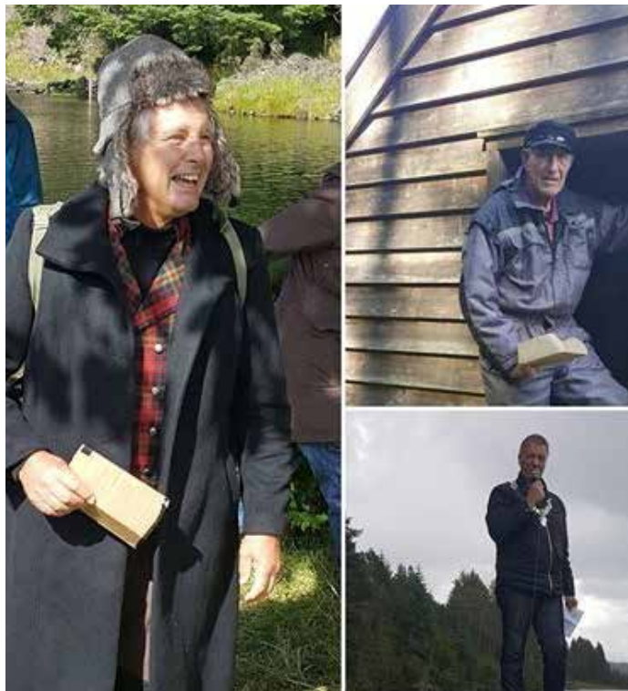
Frå opninga av kystsogevekene på Risnes 2017.