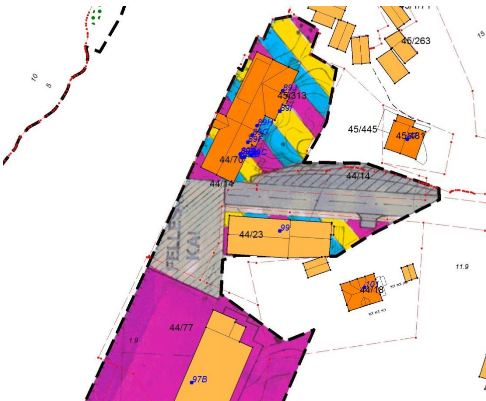
Utsnitt av reguleringsplan for Mangersvåg Industriområde