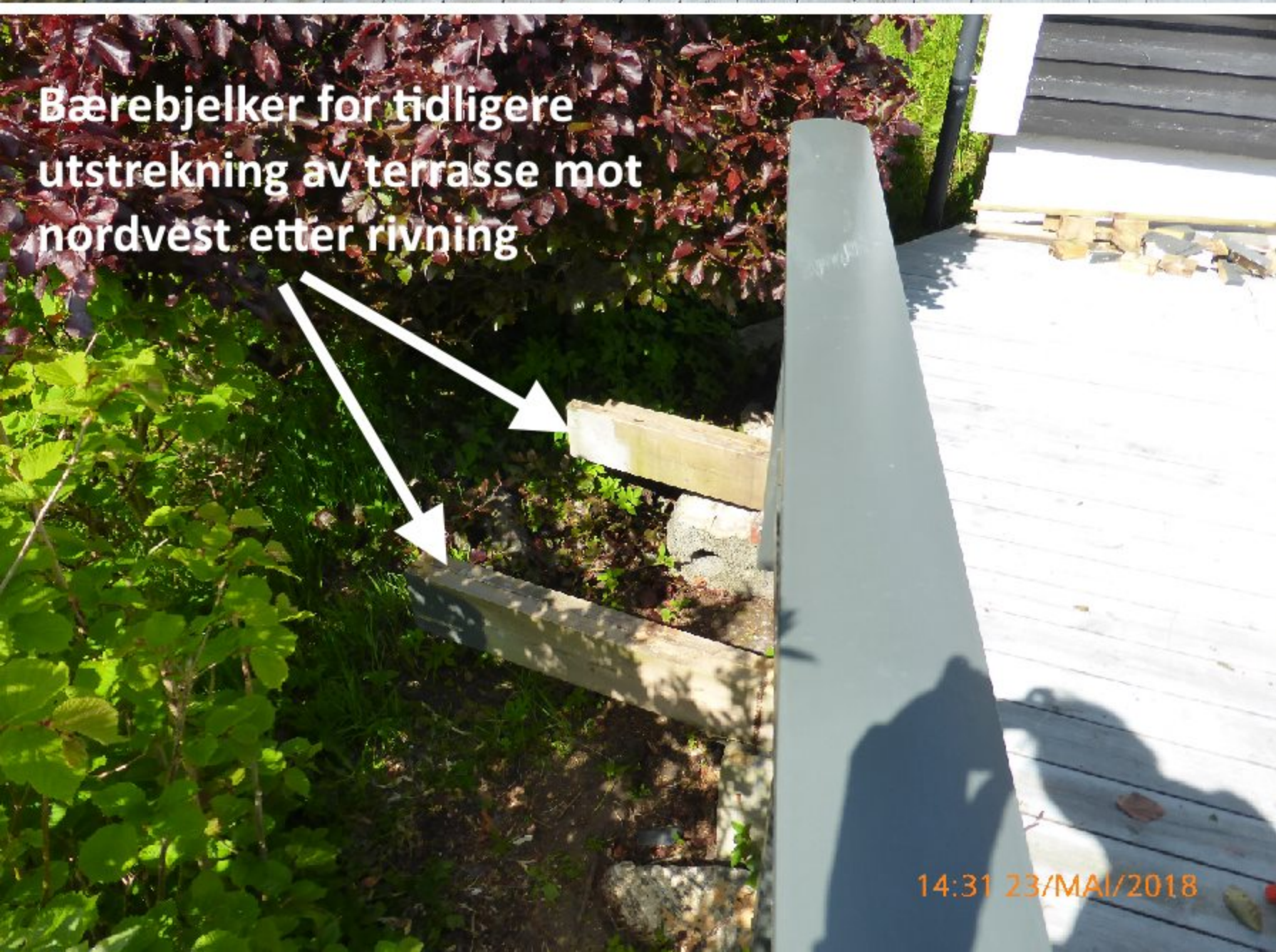
Bærebjelker for tidligere utstrekning av terrasse mot nordvest etter rivning