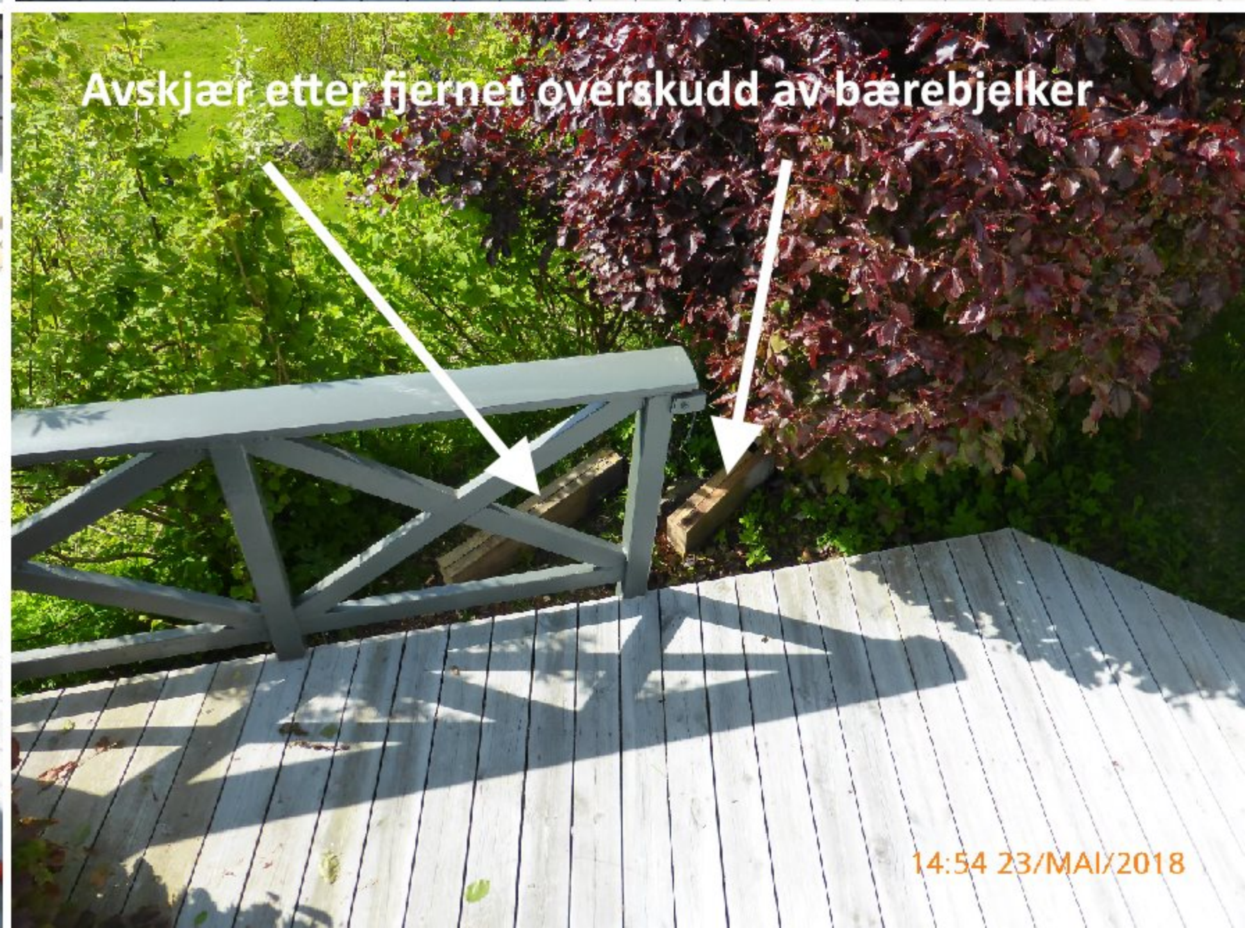
Avskjær etter fjernet overskudd av bærebjelker