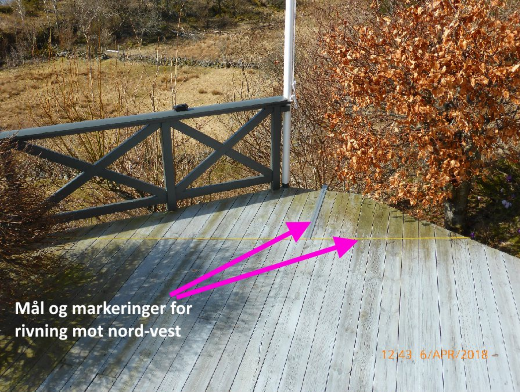
Mål og markeringer for rivning mot nord-vest