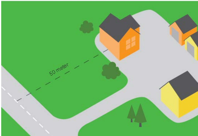
FIGUR 1 BYGGEAVSTAND MOT VEG REKNAST FRÅ VEGEN SI MIDTLINJE

«Byggegrensene skal ta vare på dei krava som ein må ha til vegsystemet og til trafikken og til miljøet som grenser opp til vegen og medverke til å ta vare på miljøomsyn og andre samfunnshensyn.»