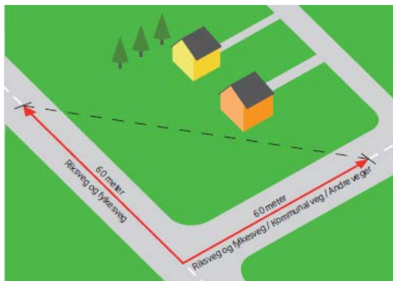
FIGUR 2 BYGGEGRENSE KRYSS

Byggegrensa i vegkryss vert målt som vist i figuren på neste side. Når primærvegen i krysset er riks- eller fylkesveg, er det 60 meter som er rette avstanden inn på begge vegane i krysset, uavhengig av kva vegstatus sekundærvegen har. For kryss mellom andre vegar skal dei tilsvarande avstandane vere 40 meter.