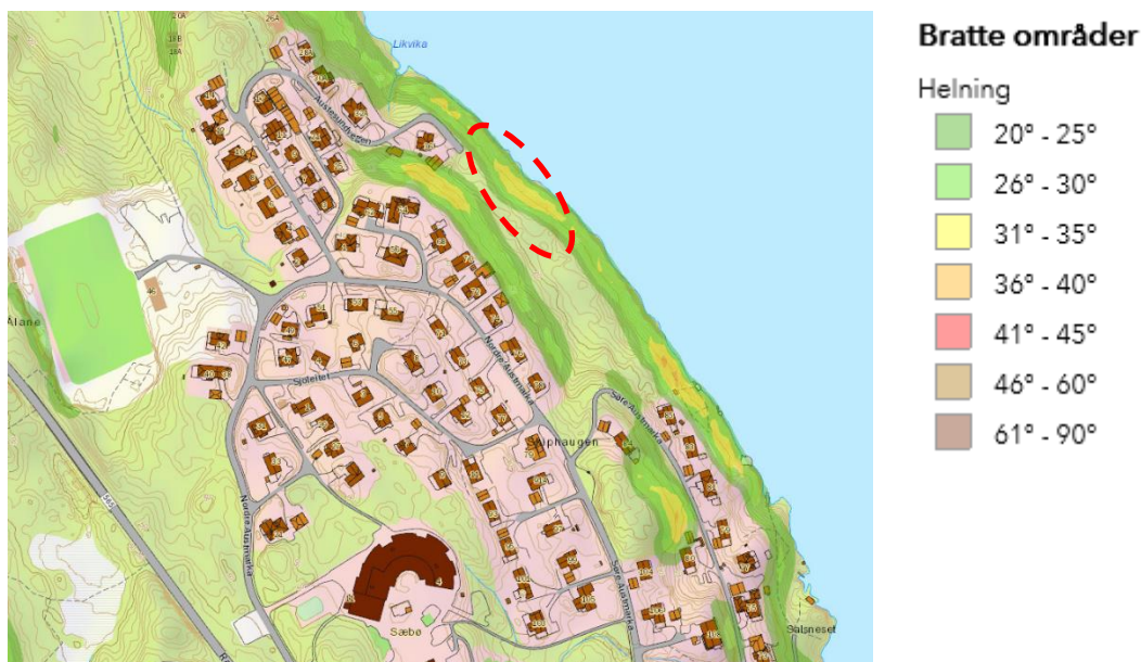
Figur 2-2: Etablering av planlagt støttemur er tenkt i det stiplede området