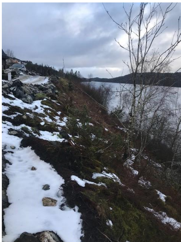
Figur 2-3: Støttemuren er tiltenkt etablert i denne skråningen