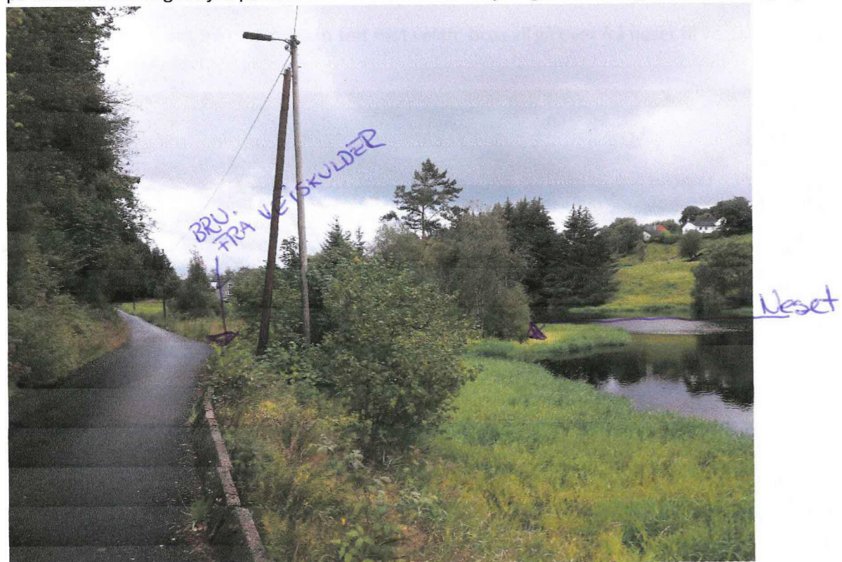
Under: Neset sett fra Treveien v/parkering. Det vil bli gjennomført rydding av kratt ved veiskulder og på neset. En del vegetasjon på neset vil bli bevart. En ser tydelig her kor langt ut steinsettinga går.