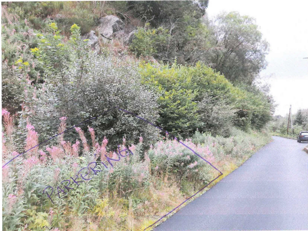
Over: Område tiltenkt parkering.