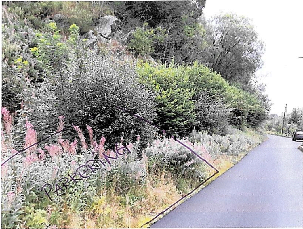
Over: Område tiltenkt parkering.

Under: Neset sett fra Treveien v/parkering. Det vil bli gjennomført rydding av kratt ved veiskulder og på neset. En del vegetasjon på neset vil bli bevart. En ser tydelig her kor langt ut steinsettinga går.