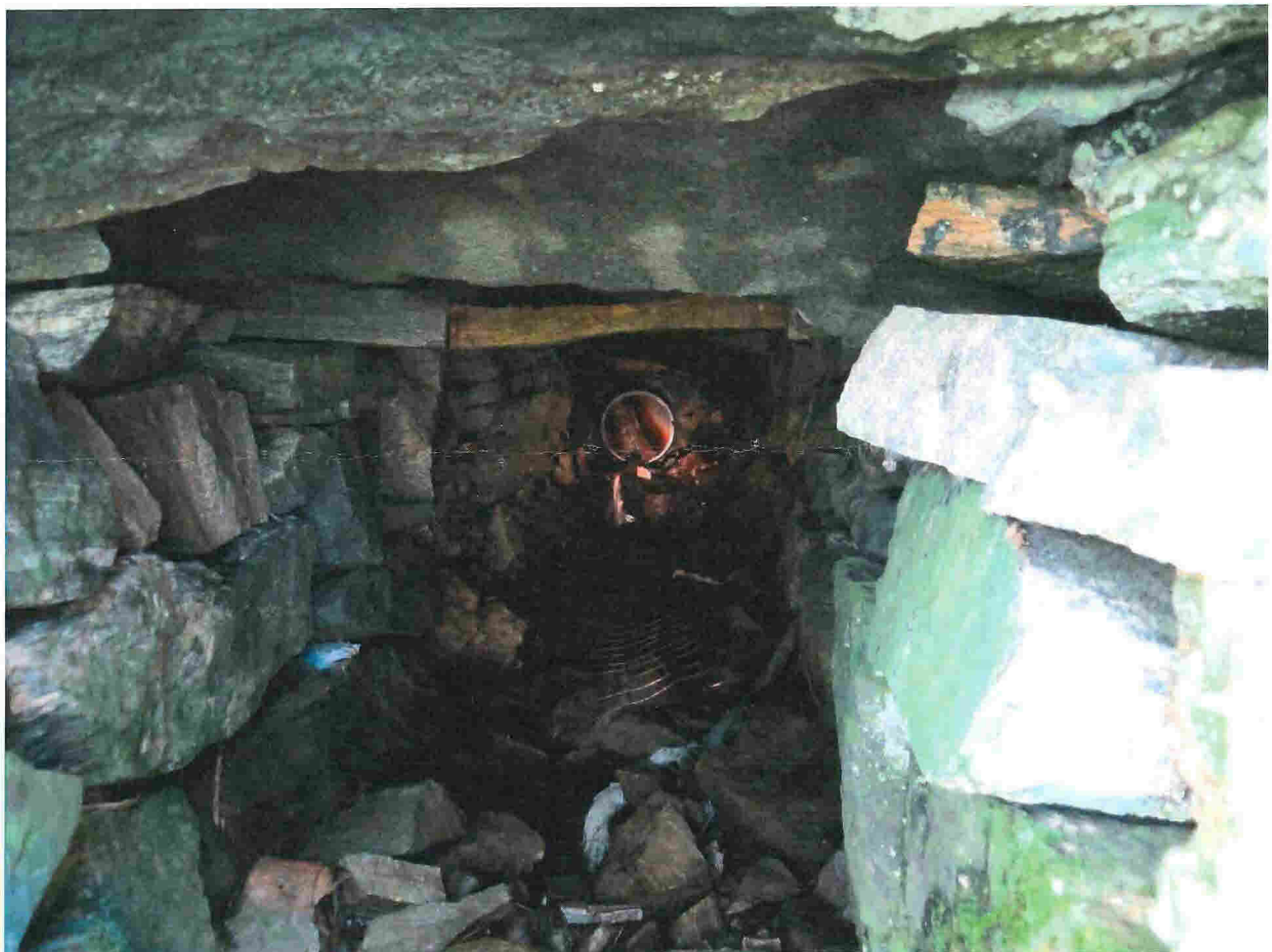
Fig. 4. Frå denne sida kan det sjå ut til at røyret – om det er 30 eller 40 cm i diameter, har langt dårlegare kapasitet samanlikna med den gamle, murte kulverten under den kommunale vegen.

Mor til Hjelle heldt fram at røyrinntaket var godt nok, men at problema skuldast mykje vatn frå eit bratt parti til venstre for bekken (sett nedstraums) der det stå ein del tre – sjå fig. 2.