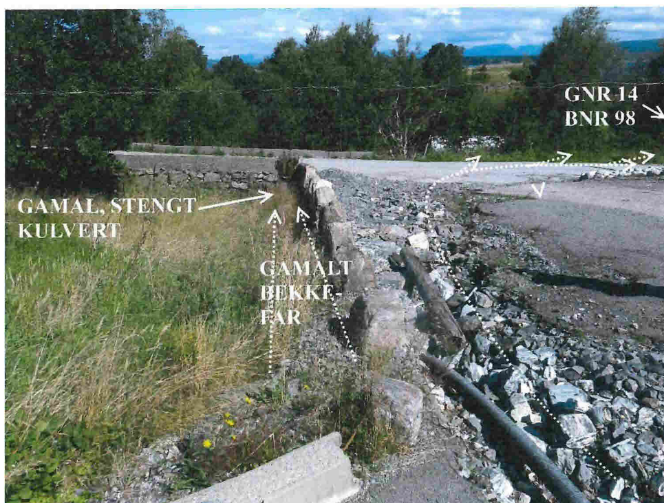
Fig. 3. ... og rann langs den kommunale vegen og ned på gnr. 14, bnr. 7 og 98.