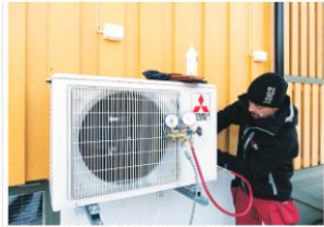
Med en luft-vann-varmepumpe kan man spare energi og miljøet.