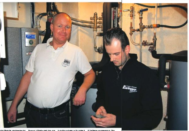
Varmepumpen er en viktig del av oppsettet for luft-vann-varmepumpen.

– Vi har hatt flere tilfeller av oljefyren som har gått i stykker. Dette er en viktig beslutning som bør tas nå, før vinteren setter inn.