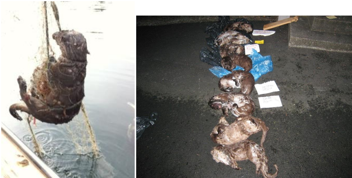
Figur 1. Otere druknet i fiskeredskap: Copyright: Terje Haugland, SNO

Uavhengig av alder og kjønn benytter både oter og mink flere forskjellige hi og overdekte leier som kvileplasser gjennom året. I en norsk hovedfagsoppgave ble det påvist at samme hi kunne bli besøkt av både oter og mink i løpet av få dager (Moseid 1990). Ynglehiene er spesielt viktige siden ungene av både oter og mink er blinde og lite utviklet ved fødselen, og en må anta at ynglehiet er eksklusivt for mora og ungene så lenge de er små. Knapphet på gode hi plasser kan tenkes å være en begrensende faktor både gjennom konkurranse om plassene og ved direkte konfrontasjoner ved og i hiene. Dette vet en imidlertid lite om. Ved etablering av oter i et område med mink er flere utfall og kombinasjoner av dem mulige, men tidligere studier, observasjoner og faglig teori tilsier en reduksjon i minkbestanden fordi denne er vesentlig underlegen i størrelse.