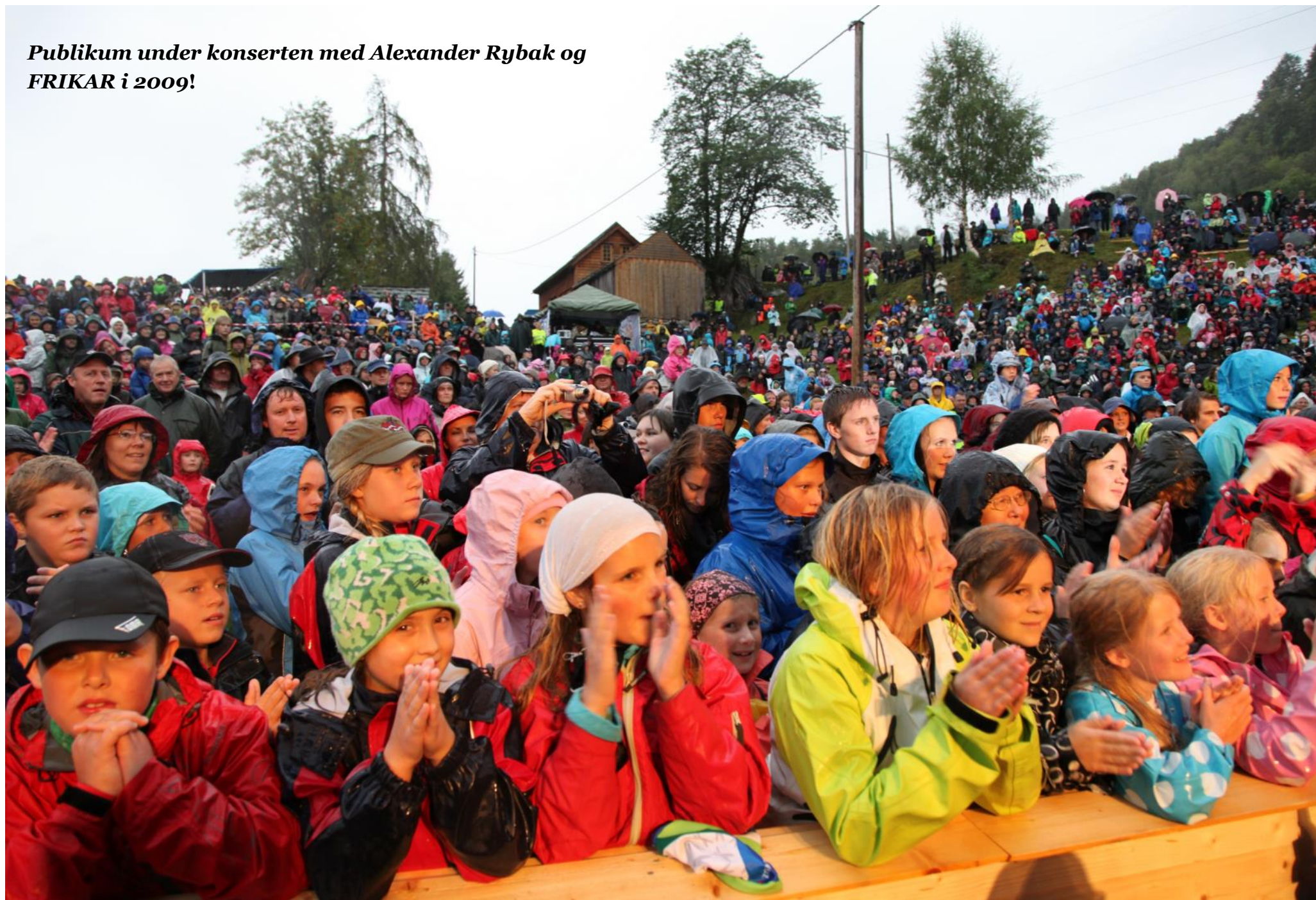
Publikum under konserten med Alexander Rybak og FRIKAR i 2009!