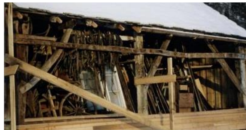
Løa ventar på ny kledning. Ein ser grindbyggstrukturen.