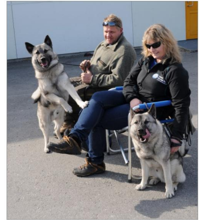
Utstilling HEK uskedalen 2013

I Kvinnherad samarbeidar elghundklubben med Kvinnherad ettersøkslag og har i denne samanhengen tilgang til terreng der ettersøkslaget har avtale om ettersøk.