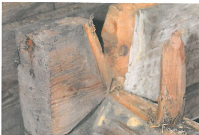
Figur 10 Eksempel på dømling i lafteverk