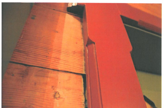
Figur 6. Horisontale forskyvninger i gavlvegg ved dør fra våpenhus