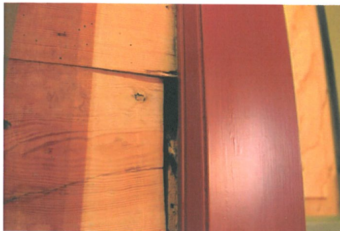
Figur 8. Horisontale forskyvninger i gavlvegg ved dør fra våpenhus