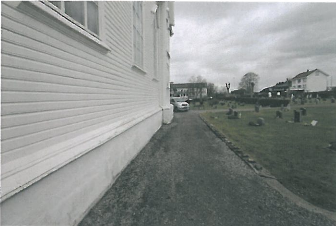
Figur 1. Grunnmur sett fra utsiden (østre langvegg)