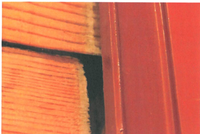
Figur 7. Horisontale forskyvninger i gavlvegg ved dør fra våpenhus