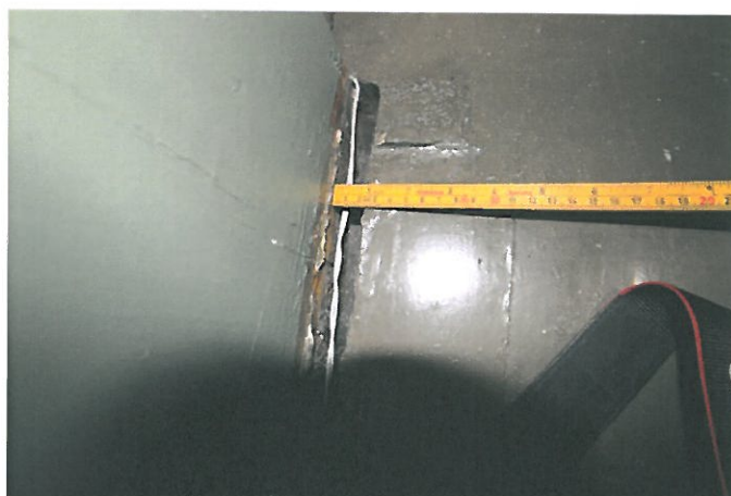
Figur 12. Sprekk på galleri