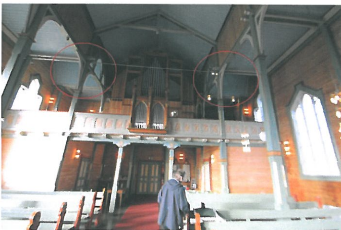
Figur 5. Brudd i horisontal himling