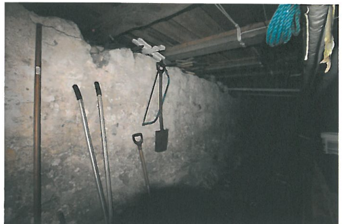
Figur 2. Grunnmur sett fra innsiden (østre langvegg).