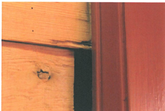
Figur 9. Horisontale forskyvninger i gavlvegg ved dør fra våpenhus