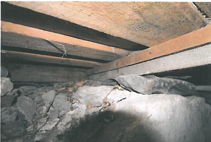
Figur 3. Bærekonstruksjon fundamentert på bruddstein