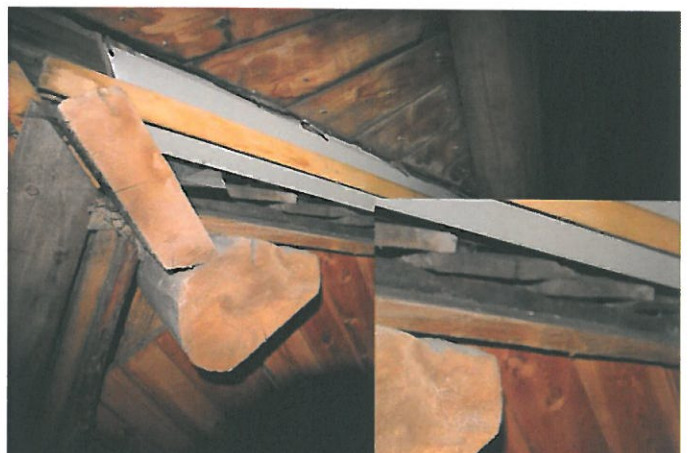
Figur 4. Langsgående sutak montert oppå underliggende bord av stående over- og underliggere.