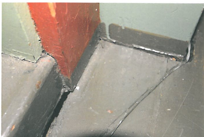
Figur 11. Sprekk på galleri