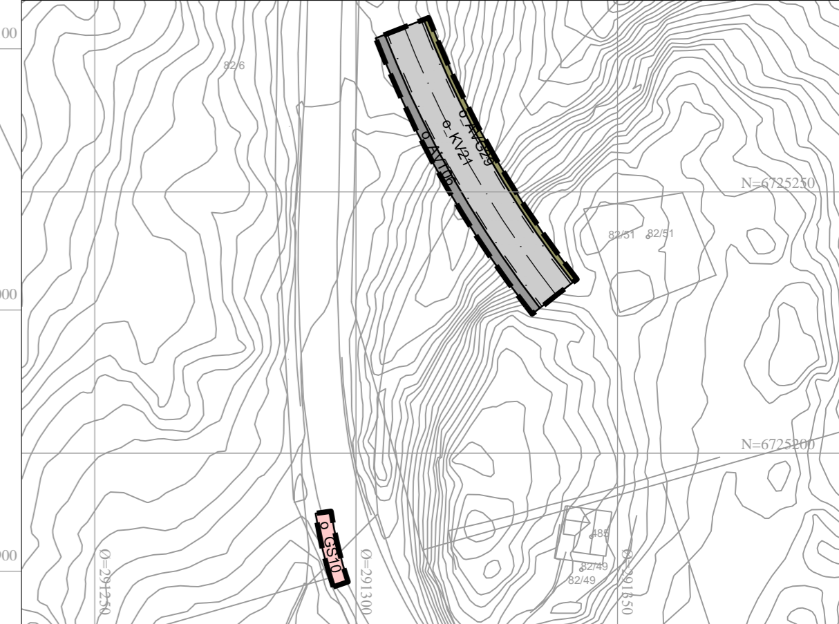
Vertikalnivå 3 - over grunnen (bru) / målestokk 1:1000