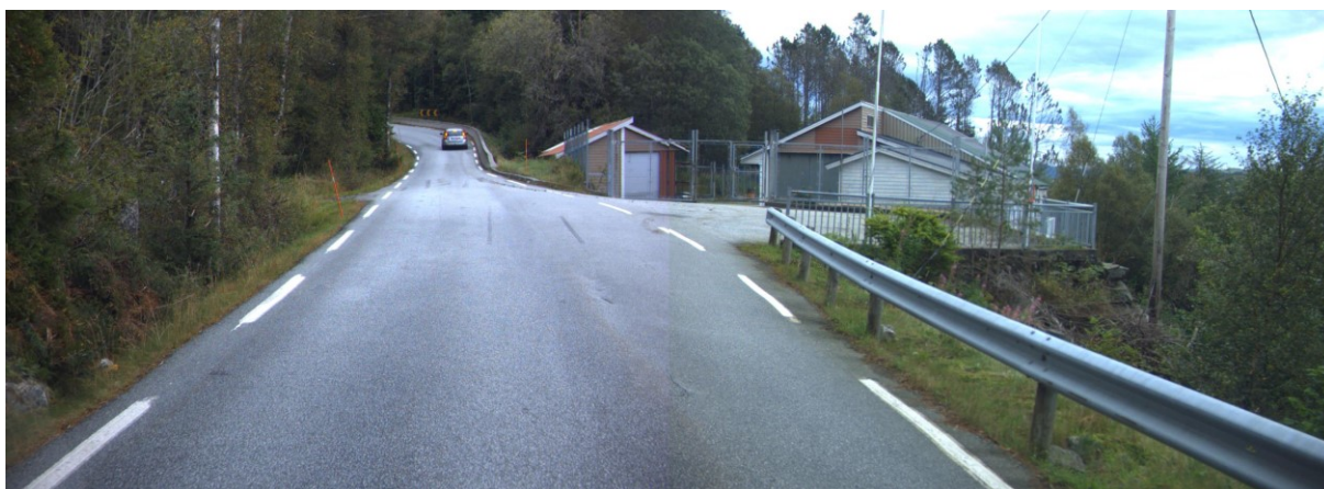
Fig: Vegbilette av avkøyrsla (2015).

Det må vere tilstrekkeleg snu og manøvreringsareal inne på eigen eigedom, slik at ein ikkje legg opp til manøvrering på fylkesvegen.