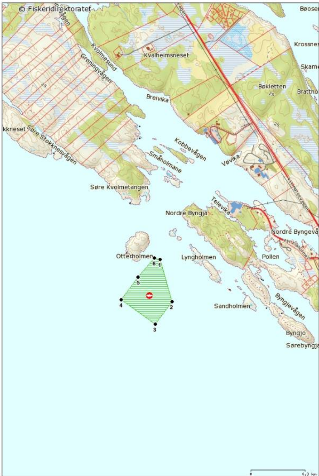
Målestokk: 1:10 000