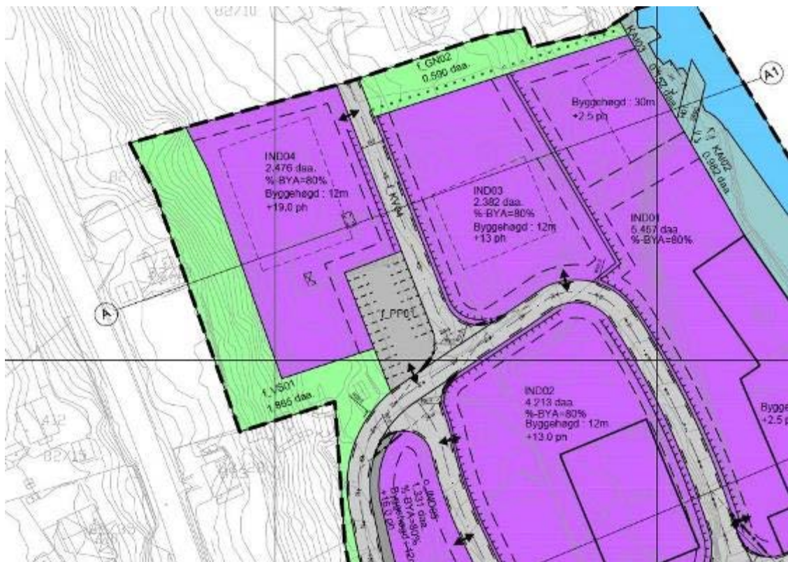
Utsnitt frå reguleringsplan Storsandvik

Det pågår ei utbetring av den kommunale vegen til industriområdet på Storsandvik, for å styrke rammevilkåra for verksemdene i industriområdet. Det er utarbeidd reguleringsplan for området som vart vedteke 06.12.2012. Arealføremål i det aktuelle området er industri og parkering. I samband med utarbeiding av reguleringsplanen har kommunen vore i dialog med folk i bygda om leikeplassen som ligg i området som no vert vurdert solgt. Leikeplassen ligg ikkje som eit arealføremål i gjeldande reguleringsplan.