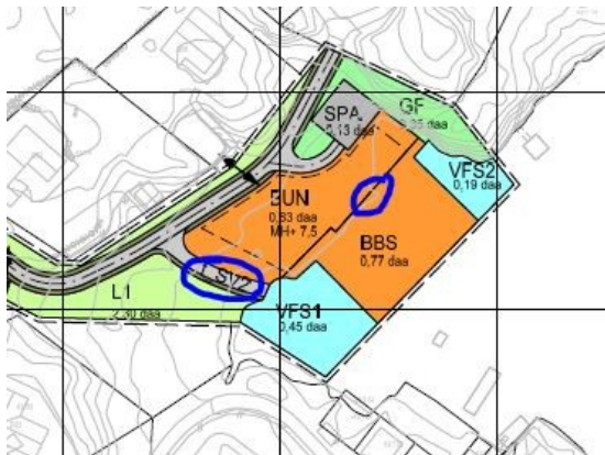
Plankart levert 22.11.16

Etter første framlegg til plankart vart det drøfta om båtopptrekk og kai burde inn i planen som eiga føremål. I endra framlegg til plankart av 22.11.2016 er kommunen sine merknader teke i vare. Det er rådmannen si vurderer at plankartet levert 22.11.16 kan leggest ut til høyring og offentleg ettersyn.