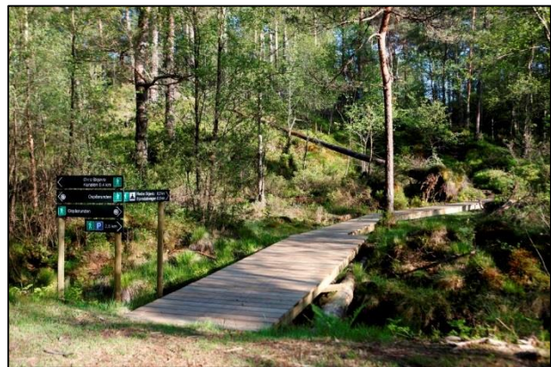
Bilete 2 og 3: Ulike former av tilretteleggingstiltak.