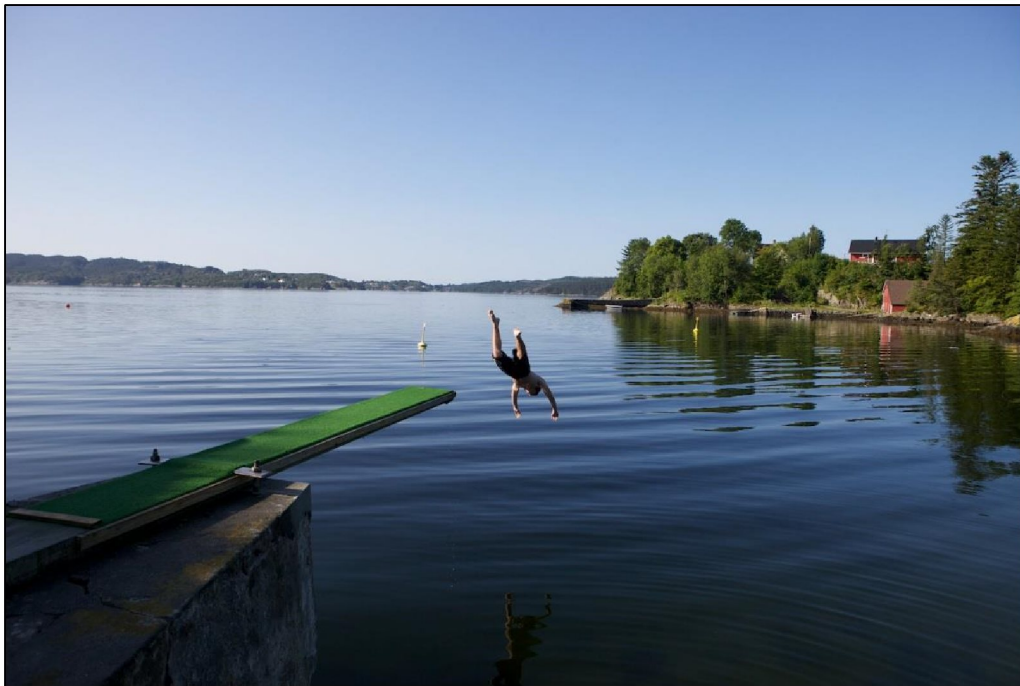
Bilete 1: Ein herleg sumardag i friluftsområdet på Fløksand.