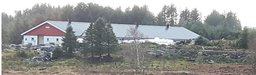
Offensiv satsing innan storfekjøttproduksjonen i Austrheim kommune sikrar eit ope landskap i mange år framover.

Dette er i tråd med etterspurnad i markedet. Me har stort underskot på norsk storfekjøtt og må årleg importere rundt 30 000 tonn storfekjøtt. Det tilsvarer 100 000 okseklakt. Dette