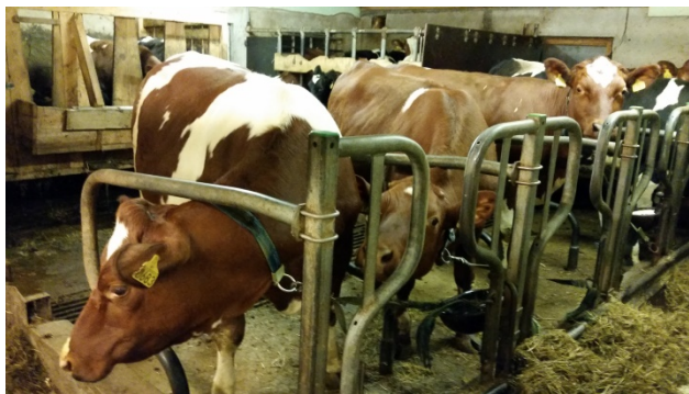
Alle mjølkekyr i Austrheim kommune står endå på bås.

I 1995 var det 12 mjølkebruk i Austrheim. Same året vart det innført mulighet for kjøp og sal av mjølkekvote innan same fylke. I dag er det 4 mjølkebruk igjen i Austrheim. Ingen av desse bruka har driftsbygning med lausdrift. Frå 2034 er det krav om at alle storfe skal gå i lausdrift. Når ein samanliknar Austrheim med resten av Hordaland i perioden 1995 til 2016 er det om lag same %-vise reduksjon i tal mjølkebruk i Hordaland som i Austrheim, 67 % vs 70 %. Mellom 25-30 % av mjølka i Hordaland vert no produsert i ein fjøs med mjølkerobot. I Austrheim er det endå ikkje fjøs med mjølkerobot.