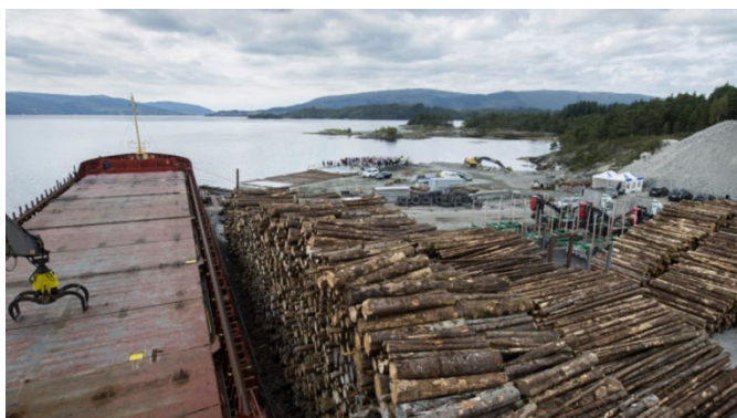
Stor aktivitet ved den nyleg utvida tømmerkaien på Eidsnes

Det er 3 mill dekar produktivt skogareal i Hordaland. Om lag 50 % av det er drivverdig. 1/3 av det produktive arealet består av planta gran. I 1966 vart det planta 27000 dekar skog mot berre 2000 dekar i 2014. Halvparten av planteskogen er no hogsmoden og det kunne potensielt vore teke ut 800 000 kbm årleg (balansekvantum). I praksis vart det i 2014 teke ut 230 000 kbm. Det er lagt til rette for ein meir kostnadseffektiv uttransport av tømmer frå Nordhordland gjennom utvidinga av tømmerkaien på Eidsnes i Lindås kommune i 2016. Men tillatt akseltrykk på kommunale vegar er framleis ei utfordring.