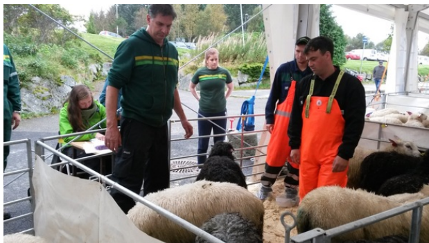
Kåring av vêrlam er eit viktig ledd i avlsarbeidet for sau. Det er også eit viktig sosialt møtepunkt for sauehaldarane.

Ifølgje SSB hadde sauehaldet i Austrheim kommune ei brutto omsetning på kr 2 100 000 i 2013.