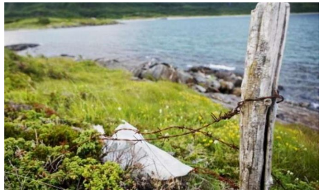
Før var piggråden mykje nytta på gjerder. Det er ikkje lengre tillatt å setta opp nye gjerder med piggråd jfr dyrevelferdslova

Ei anna utfordring er at mange av driftsbygningane er av eldre dato og det trengst oppgraderingar, noko som krev investeringar. Med små einingar er det mindre investeringsvilje til oppgradering av driftsapparatet. Og det er mindre vilje frå Innovasjon Norge til å bidra med investeringsmidlar når gardsbruka er små. Innovasjon Norge krev 10 års skriftlege jordleigeavtalar der arealgrunnlaget er del av driftsgrunnlaget for investeringssøknadar. I dei tilfella der ein bonde ønskjer utvide drifta si og investere vil ein mangel på skriftlege 10 årskontraktar for leigejord kunne medføre avslag på søknad om investeringsmidlar hos Innovasjon Norge.