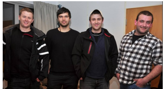
God rekruttering til landbruket i Austrheim

Austrheim kommune har ungdommar som har etablert seg i landbruket og som har pågangsmot og arbeidslyst. Landbruksmiljøet i Austrheim er opptekne av rekruttering, og at ungdommar vil og får det til er svært positivt.