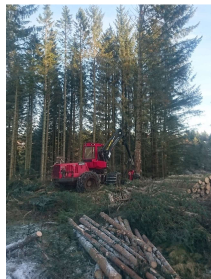
Nær all skog som vert høgda i dag vert høgda med hogstmaskin og transportert til veg/velteplass med lassbærar.

Austrheim kommune har godkjent skogreisingsplan frå 1967. Planen la opp til å plante 500 daa/år over 24 år med eit totalt skogreist areal på 12000 daa. I gjennomsnitt vart det planta 163 daa pr. år. Føresetnadane for skogreising som tildømes lovgrunnlag, lønsemnd i skogkultur og vegbygging, fleirbruksinteresser og trong for sysselsetting har endra seg. Det vart derfor utarbeidd tiltaksplan for skogbruket i kommunen, handsama av kommunestyret 14.04.90 og av fylkesmannen i 1994. Etter tiltaksplanen er 1500 da snau mark og 1000 da myr, tilsaman 2500 da eigna til skogreising.