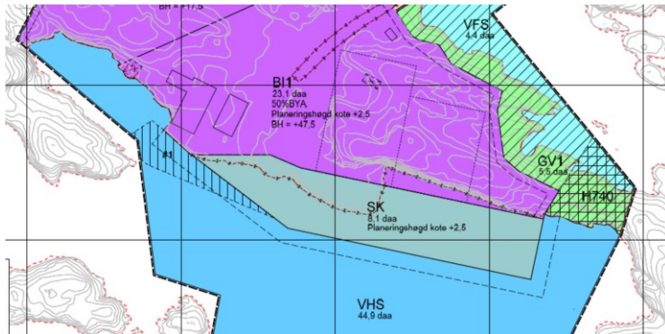
Utsnitt frå reguleringsplanen i sak 267/2017

Det er opplyst i søknaden at det utvida kaiområdet ligg innafør arealføremål SK og at den utvida fyllinga i sjø ligg innafør byggegrense i arealføremål VHS.