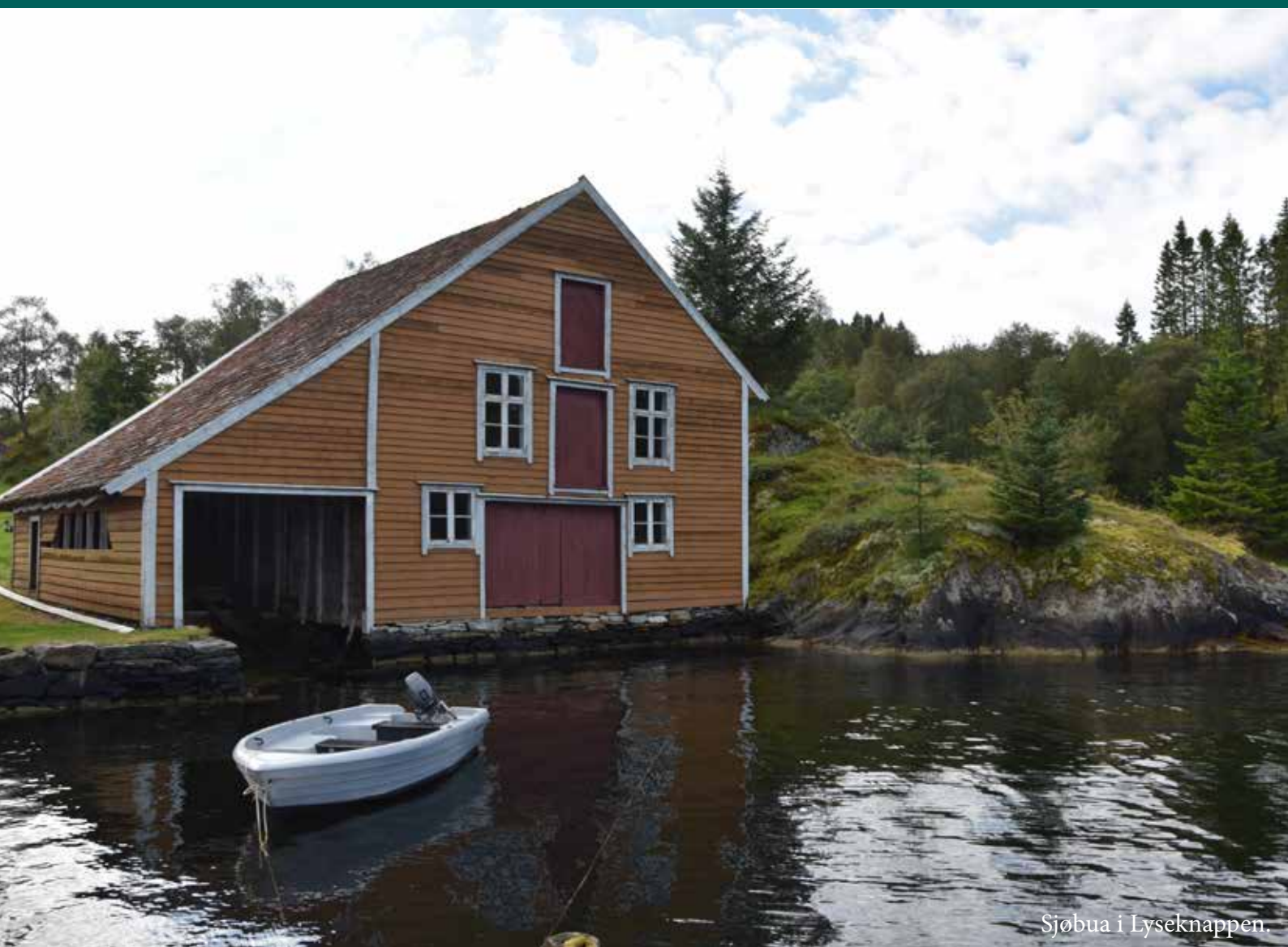
Sjøbua i Lyseknappen.

Informasjonsskriv frå kulturadministrasjonen i Radøy kommune