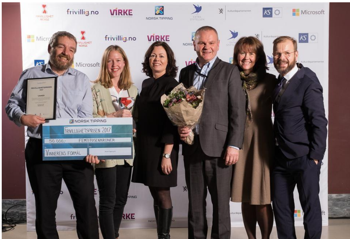
Kirkens SOS mottok Frivillighetsprisen 2017