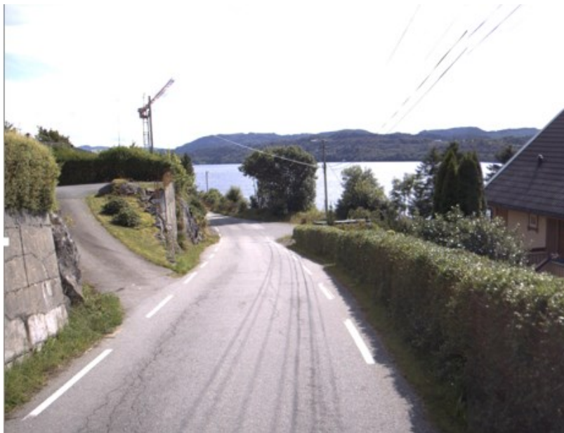
Bilete: Eksisterande avkøyrsla (alt. 2).

tilfredsstilt. Vi ser ikkje at dette lar seg praktisk gjennomføre utan store inngrep i terrenget, og i tillegg må ein pårekne store kostnader utan at avkøyrsla vert vesentleg betre.