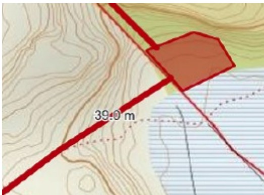
Utsnitt frå situasjonskart

Vegen skal førast fram igjennom eit landskap som delvis er fastmark og delvis myr. Området er kupert. Spesielt siste del av vegen ligg i bratt landskap med høgdeskilnad på ca 8 meter over ei strekning på ca 35 meter. Søknaden er ikkje vedlagt snitt eller lengdeprofilar som viser korleis vegen er tenkt plassert i terrenget, og det er ikkje avklart i søknaden om det vil vere mogleg å ivareta stigningskravet på 1:8 etter Kommuneplan for Radøy kommune.