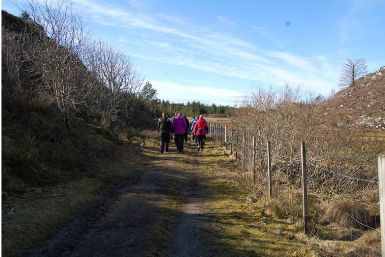
Grusveg mot Syltaneset

Etter ei konkret og samla vurdering er det rådmannen sin konklusjon at vilkåret i pbl. § 19-2 om at omsyna bak arealføremålet ikkje må verte vesentleg sett til side ved ein dispensasjon, ikkje er oppfylt.