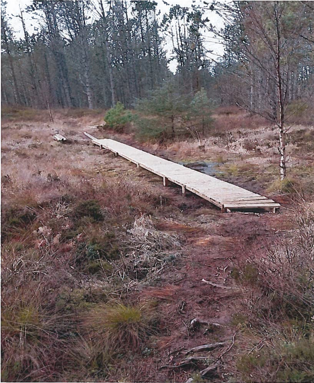
Bilde 5: Utlegging av klopper i myrlendt terreng.