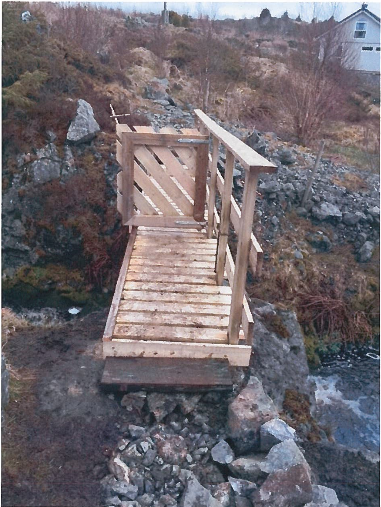
Bilde 4: Trebro m/ grind for gjennomgang.