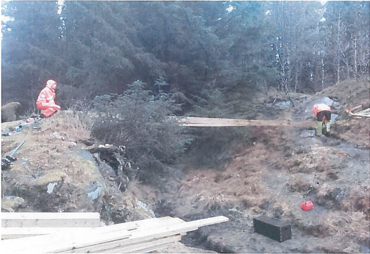
Bilde 2: Bygging av trebro.