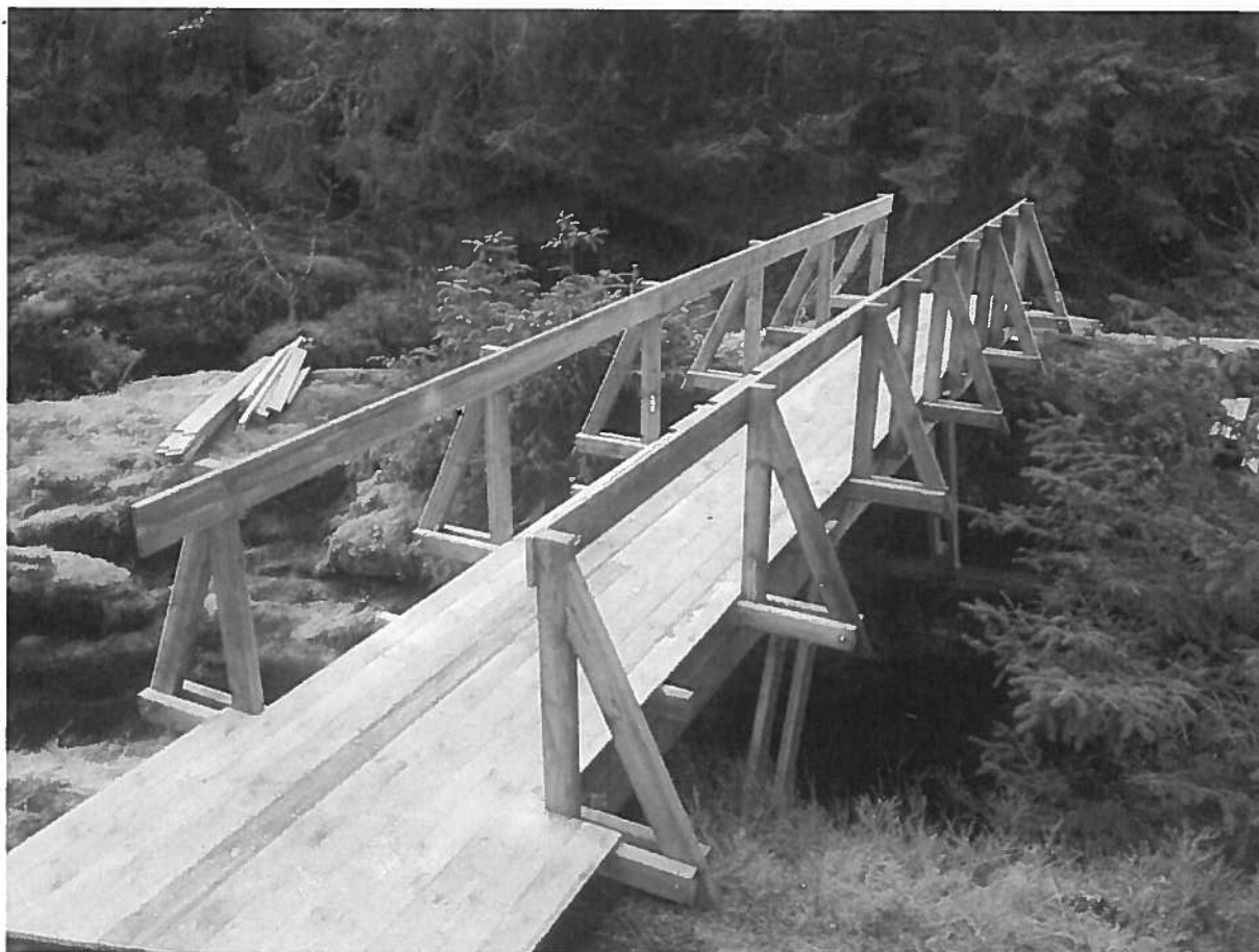
Bilde 1: Bro over elven fra Træsvatnet.