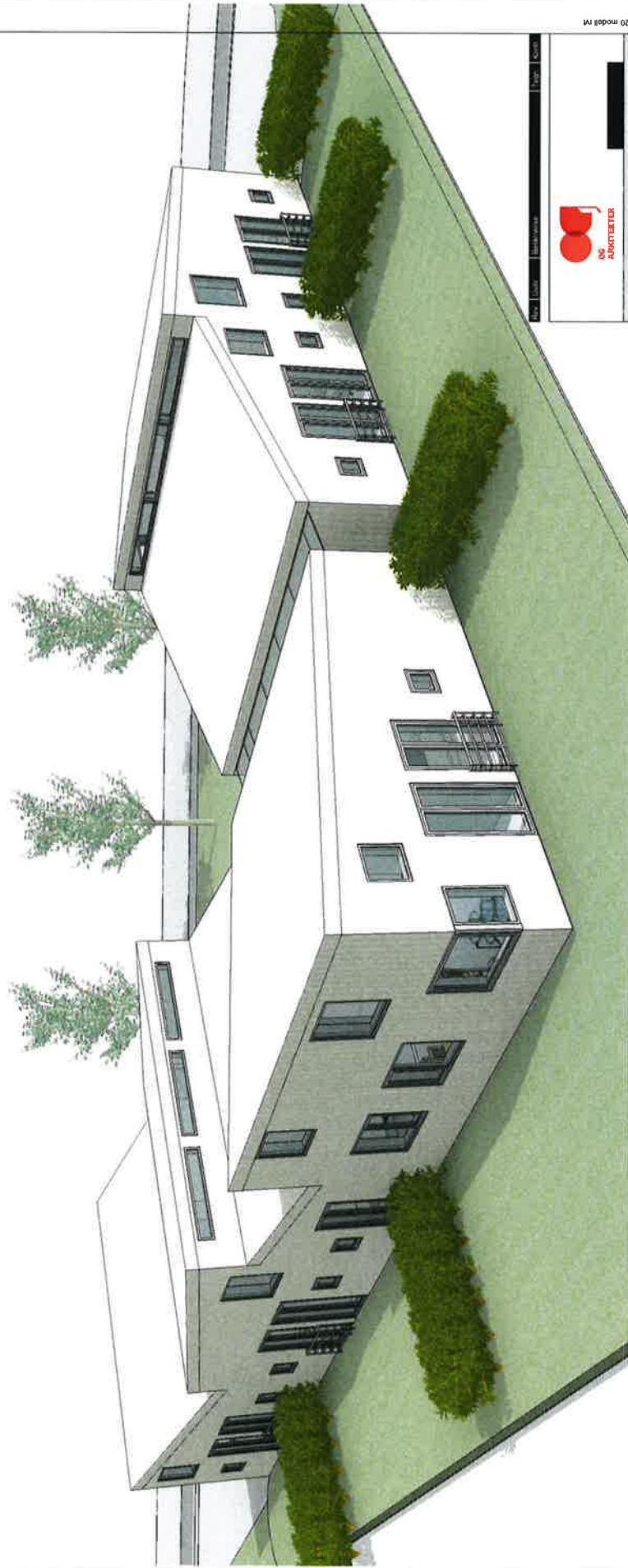
Perspektiv fra sør-vest