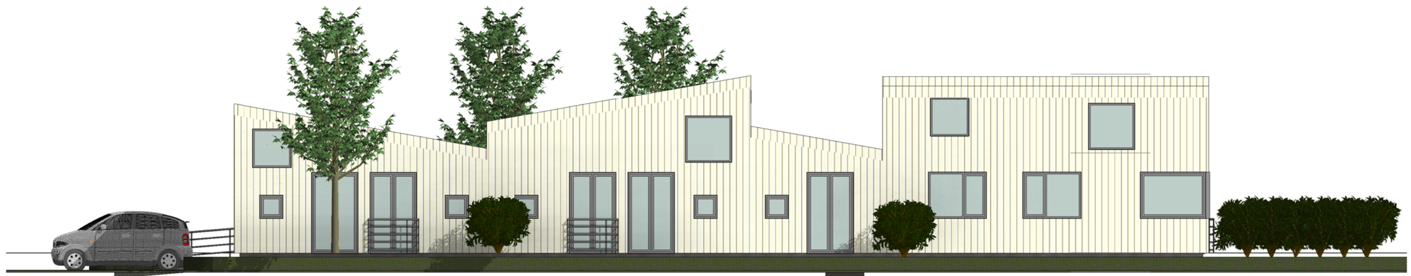
2 Sør-øst 1 : 100