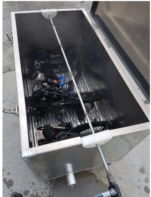
Vaskeprosessen er avsluttet – rent utstyr.