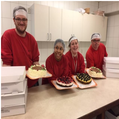
Klar for levering

diverse urteprodukt med meir. I tillegg er lunsjtilbodet for dei som jobbar på Aufera ein viktig del av kjøkkenet. I flg. «Kravspesifikasjonen» frå NAV plikter me å ha fokus på kosthald, noko som er naturleg og lettare når me tilbyr lunsje. Mange som arbeider på Aufera et gjerne dei andre måltida åleine, og den sosiale delen av lunsjen vert med det svært viktig.