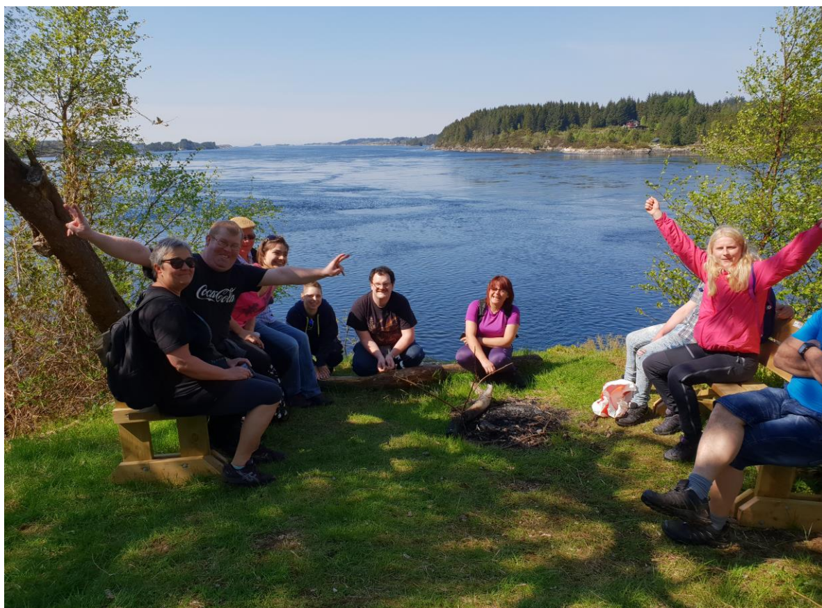
Ein glad gjeng på tur til Steinalderstien på Straume etter arbeid.

Me har stor tru på at 2019 vil og må verta det året me kom oss i nye større lokaler. Enno eit merkeår for Aufera står for tur.