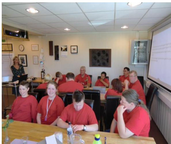
Kurs i kommunikasjon

Utover dette har det vore ordinært tilsette på kurs i: