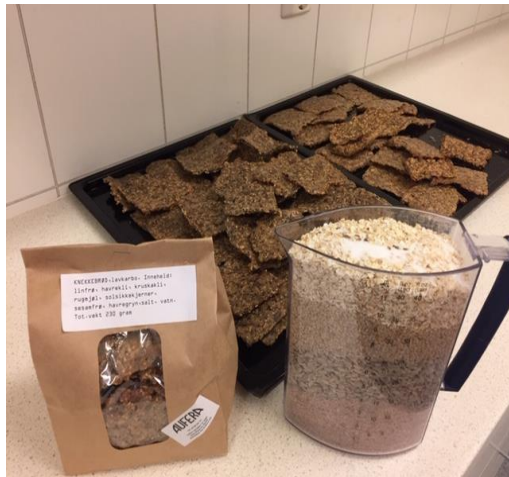
Mange som vil ha dei sunne og gode knekkebrøda