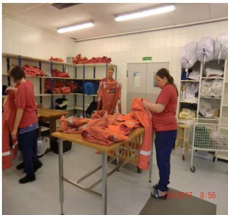
Bretting og sveising av tøy