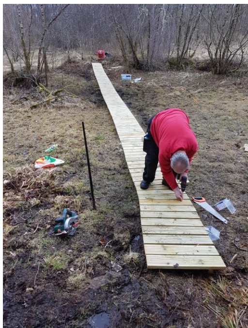
Klopper på steinalderstien

Treavdelinga produserer ulike treprodukt som t.d. notkassar, hagemøblar, blomsterkassar, varmpumpedeksel og postkassestativ. Avdelinga har og hatt ein del oppdrag med å laga/setja opp gjerdekliv og har hatt oppdrag med å leggja ned «kloppar». Det har vore god tilgang på oppdrag siste året, særleg innafor fiskeriindustrien. I store trekk vert det som skal gjerast av vaktmeisteroppdrag på eige bygg, gjort av denne gruppa. Gruppa har og ein del vaktmeisteroppdrag for andre, både private og offentlege.