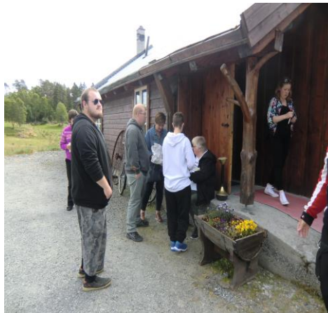
God stemning på «Blåturen» til Sansetunet