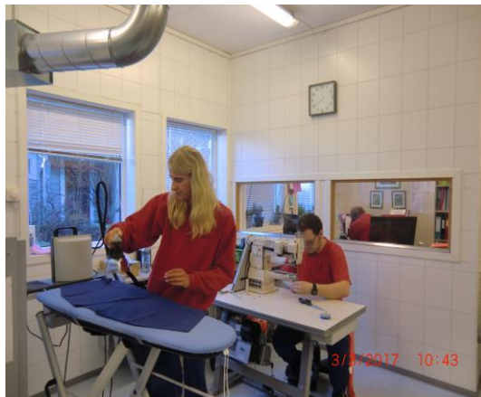
Stryking, reoperasjon og litt kontorarbeid.