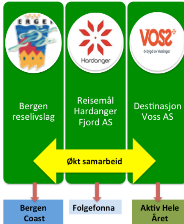
Figur 2. Forslaget til ny struktur basert på tre destinasjonsselskap og sentrale strategiske produkt/markedsprosjekt

Gjennom prosessen i dette prosjektet har destinasjonsselskapene satt fokus på heve egen effektivitet og bedre ressursutnyttelse i tillegg til de strukturelle endringene innenfor geografi. Følgende arbeidsoppgaver ble trukket frem med potensial for samordning mellom de tre selskapene: