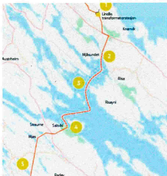
Figur 1: Kartet viser kvar BKK har planlagt å krysse Lurefjorden med sin 420 kV sjøkabel frå Mongstad-Kollsnes. Det vil vere tre sjøkablar som blir gravne ned til om lag 30 meters djup, på fjordbotnen vil kablane ligge med 25 meters mellomrom. Kablane er tunge, så dei vil søkke ned til fast grunn der det er lausmassar på fjordbotnen.

mellomrom mellom kvarandre. Der det er lausmassar vil kabelen søkke gjennom lausmassane til fast grunn.