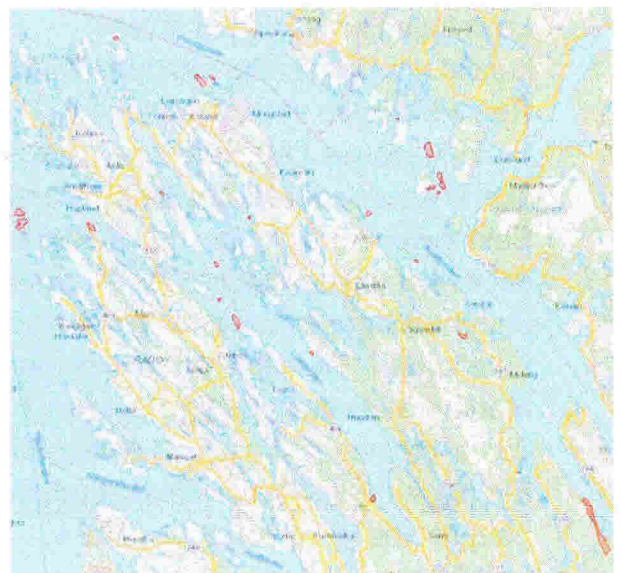
Figur 4: Kartet er eit oversiktsbilete over dei allereie eksisterande verneområda innafør det føreslåtte kandidatområdet for marint vern.

Det er i dag fem mindre sjøfuglreservat i Lurefjorden og Lindåsosane. Desse blei oppretta i 1987 for å verne om hekkeplassar til sjøfuglane. Reservata omfattar holmar med ei sone på 50 m i sjøareala rundt der det er ferdselsforbod i hekkesesongen. I tillegg ligg naturreservatet Vollom ned mot kandidatområdet. Der er verneføremålet å ta vare på ein bøkeskog.