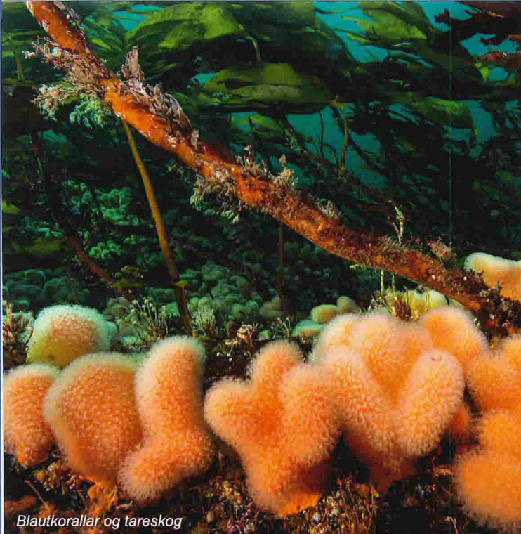
Blautkorallar og tareskog