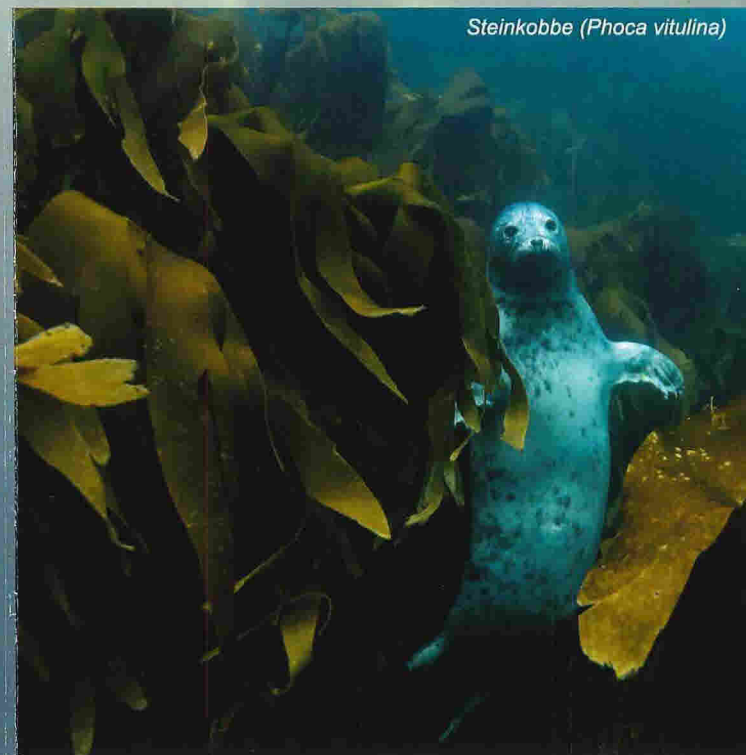
Steinkobbe ( Phoca vitulina )

I verdssamanheng er dette eit unikt fjordsystem, og heilt spesielle artar har teke bustad her. Sterk straum gjennom sunda gir gode vilkår for tareskog og blautkorallar. I Lurefjorden dominerer kronemaneten heile næringskjeda og vi finn store mengder av ishavsåte. Lindåsosane har grunne sund som avgrensar vasstraumen frå fjordsystemet utanfor og gjer botnvatnet oksygenfritt. Lindåsosane husar også ein heilt eigen sildestamme, som lev heile sitt liv innafor pollane.