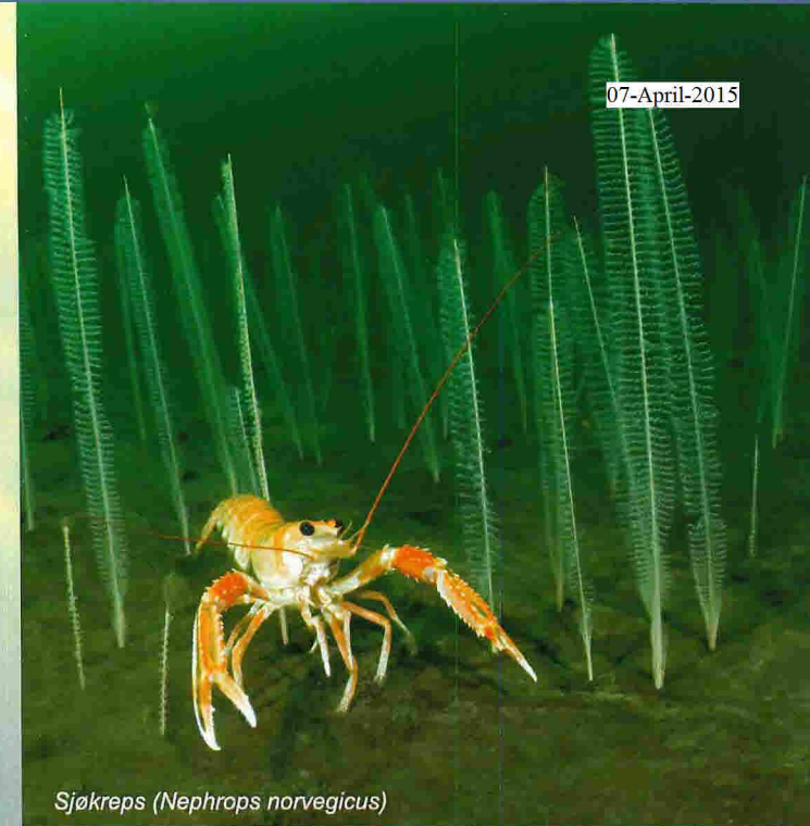
Sjøkreps ( Nephrops norvegicus )

Korsfjorden er blant dei mest utforska kystområda her til lands. Kandidatområdet består av eit fjordbasseng med djupne ned til 700 meter og kystområda vest for Sotra. Naturen her er rikhaldig, med variert undersjøisk topografi og eit stort mangfald av naturtypar. I dei opne kystområda finn vi store tareskogar med eit imponerende dyreliv. I fjorden er det bratte fjellveggar dekorerte med flotte korallar og svampar. Dette gjer at området er særst rikt på marine organismar og har høg verneverdi.