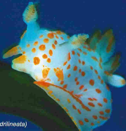
Nakensnegl ( Polycera quadrilineata )

Våre tre kandidat område for marint vern i Hordaland vert presenterte her.