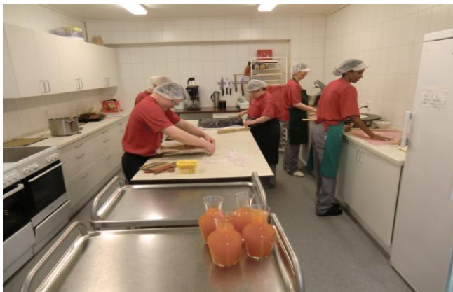
Full konsentrasjon på kjøkkenet