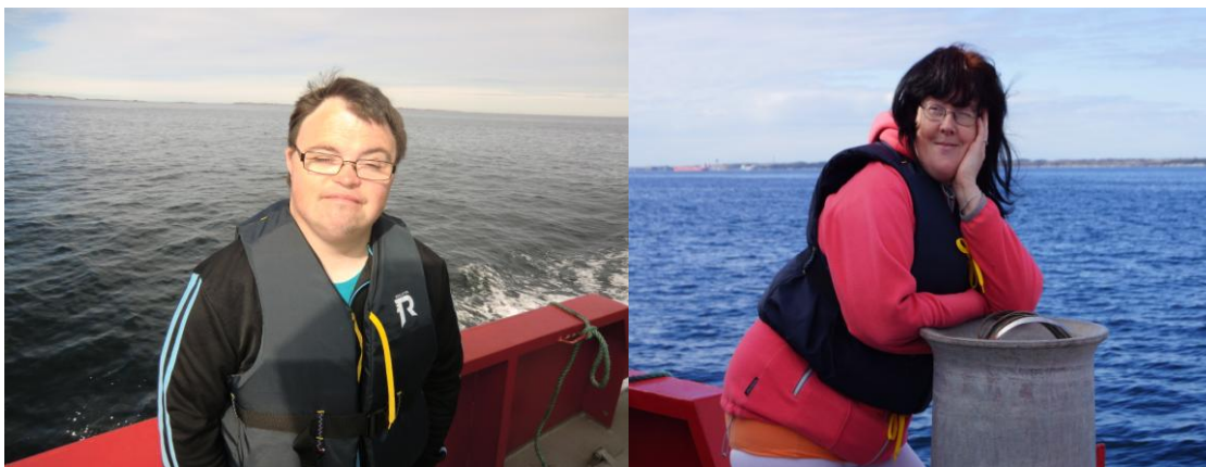
Frisk luft og litt vind gjer godt

Det har i 2013 vore 17 personar inne på dei 5 APS-plassane og 18 personar på dei 15 VTA-plassane. Ved årsskifte var det 5 personar som hadde tilbod om APS-plass og 17 på VTA-plass. Aufera har framleis hatt vanskar med å fylla opp VTA-plassane. I periodar av 2013 fekk me mindre i tilskot frå NAV enn tilsegn grunna ledig kapasitet. Trass gode dialogar med lokale NAV og eigarane våre, slit me med å fylla opp plassane. Årsaka til dette er vanskeleg å sjå, då andre verksemdar rundt oss har ventelister for VTA-plass.