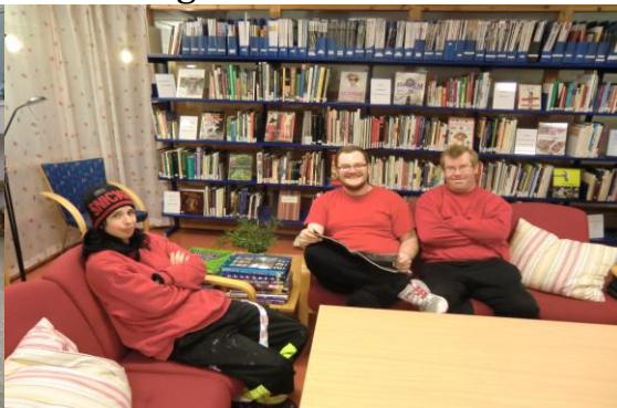
Frå besøk på Radøy folkeboksamling