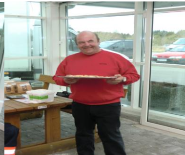
Klar med smaksprøvar

Treavdelinga/Vaktmeistergruppa har markert seg meir og meir og med det fått fleire oppdrag. Ein del ryddeprosjekt, rydding i