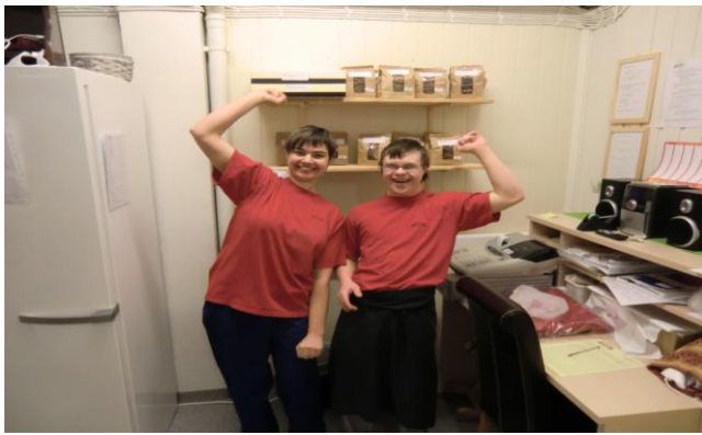
To glade representantar