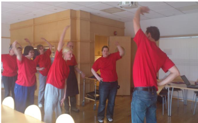
Frå demonstrasjonen på Austrheim

Nytt i 2013 var eit samarbeid med alle vekstverksemdene i Nordhordland, om felles aktivitets dag i Nordhordlandshallen. Om lag 200 menneske var samla til ulike aktivitetar. Målet er at dette skal verta ei årleg hending.