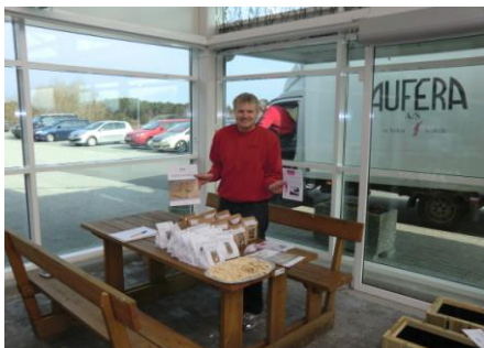
Klar med knekkebrød og kassar