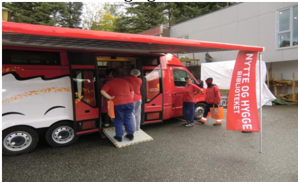
Kø framfor Bokbussen

Ei anna hending i 2013 var "Nytte og hygge", eit prosjekt som Lindås bibliotek stod bak. Dei hadde fått prosjektmidlar til forfattarbesøk og besøk av bokbussen på ein del arbeidsplassar. Aufera hadde gleda av slikt besøk to gangar. Etter det fekk me og invitasjon til besøk på Radøy folkeboksamling og hadde ein lærerik formiddag der.