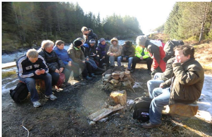
Kaldt , men veldig kjekt.

Vår målsetjing om mange fellesturar etter arbeid kom me ikkje heilt i mål med. Litt vart det. Me hadde ein flott tur til Hoplandskvernene.