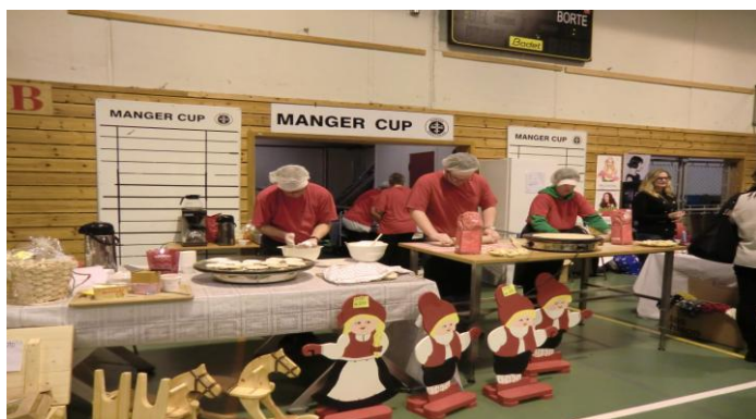
Ivrige lefsebakarar på messa

Aufera as er eit aksjeselskap eigd av kommunane Austrheim, Fedje og Radøy. Verksemda er lokalisert i alle tre eigarkommunane. Selskapet vart skipa i 2005. Aufera hadde tilsegn på 15 VTA-plassar og 5 APS-plassar i 2013. Verksemda har ein rein kommunal plass, tre elevar med særskilte behov frå vidaregåande skular har hatt arbeidsutprøving og tre personar har hatt språkpraksisplass i verksemda.