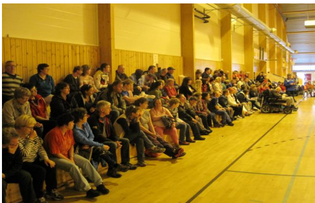
Ivrigte tilskodarar til ein av kampane

Nytt i 2013 var eit samarbeid med alle vekstverksemdene i Nordhordland, om felles aktivitets dag i Nordhordlandshallen. Om lag 200 menneske var samla til ulike aktivitetar. Målet er at dette skal verta ei årleg hending.