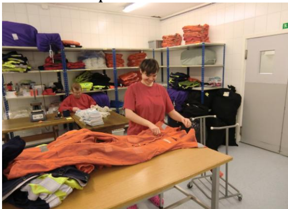
Konsentrert i arbeidet

Produkt: Avdelinga driv kantina for tilsette i kommunen. Også her vert det produsert "møtemat" og bakverk til både kommunale og private.