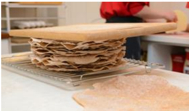
Flatbrød i press

I haust vart me resertifisert i kvalitetssikringssystemet Equass. Mykje arbeid og stor ressursbruk ligg bak det. No har me sertifikat på at me kan ha VTA-plassar, APS-plassar, kommunale plassar, elevar frå vidaregåande skular og språkpraksisplassar fram til desember 2015.