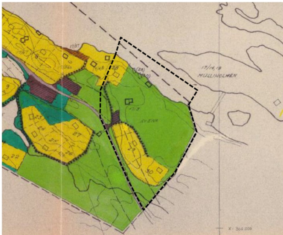
Figur 2: Utsnitt av gjeldande reguleringsplan for området, Rossnes. Planområdet er markert omtrentleg med svart stipla line.

Føremålet med planarbeidet er å leggje til rette for å kunne endre plassering av nye fritidsbustader samenlikna med det godkjente i reguleringsplan for Rossnes. I tillegg er det ynskje om 1 ekstra hytte med naust, samt gangveg til sjø og flytebyggje.