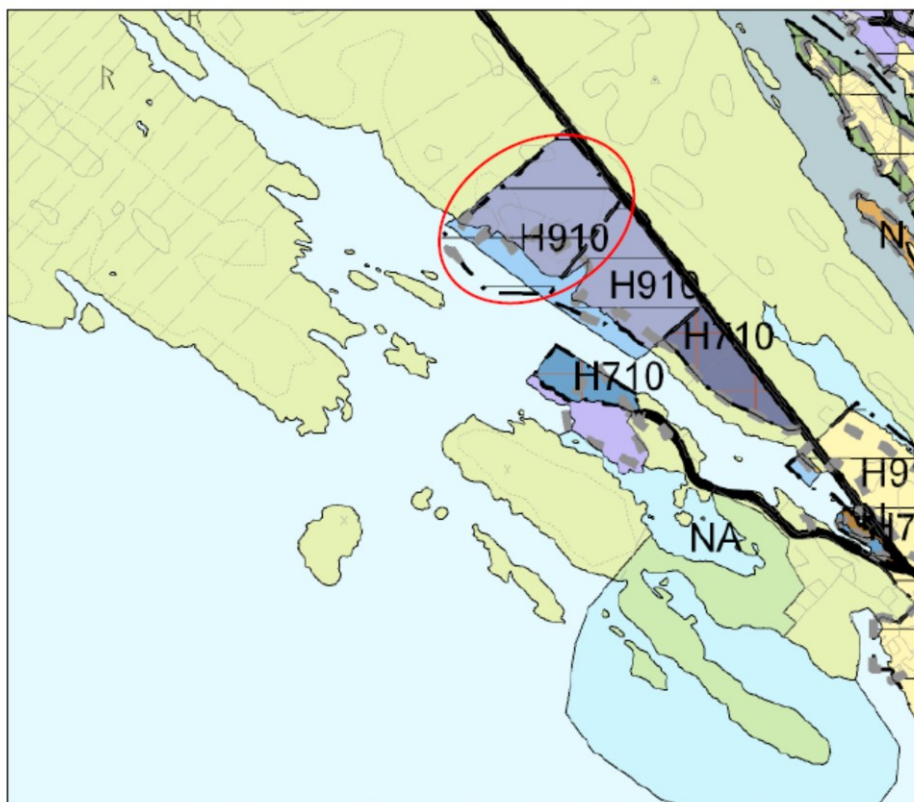
Figur 1. Kartutsnitt frå gjeldande KPA (2011 – 2023) planID 12602008000300 (Braplan.no). Planområdet merket med sirkel.