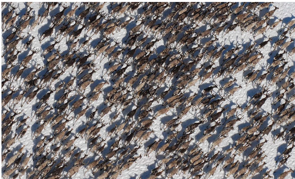
Villrein flokk sett fra lufta.

Norge forvalter de siste livskraftige bestandene av den opprinnelige ville fjellreinen i Europa, og har derfor et internasjonalt ansvar for forvaltning av villrein. Artens nomadiske livsførsel gjør at den krever store leveområder som ofte krysser både kommune- og fylkesgrenser. Ulike typer inngrep og forstyrrelser gjør villreinens leveområder stadig mindre og mer oppdelt, og det er viktig å sikre ivaretagelse av de gjenværende arealene.