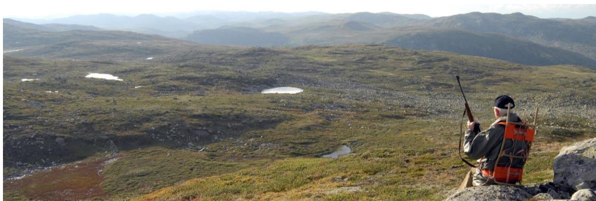
Jeger som venter på villrein i fjellet.