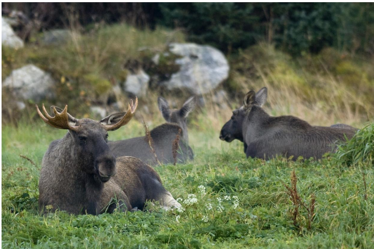
Elgokse og to elgkyr.

Kommunene har hovedansvaret for den offentlige forvaltningen av elg, hjort og rådyr. I tillegg til å bidra til ivaretagelse av bestandene og deres leveområder, har kommunene et stort ansvar for offentlige interesser knyttet til hjortevilt, blant annet opplevelsesverdier, biologisk mangfold og trafikkproblemer.