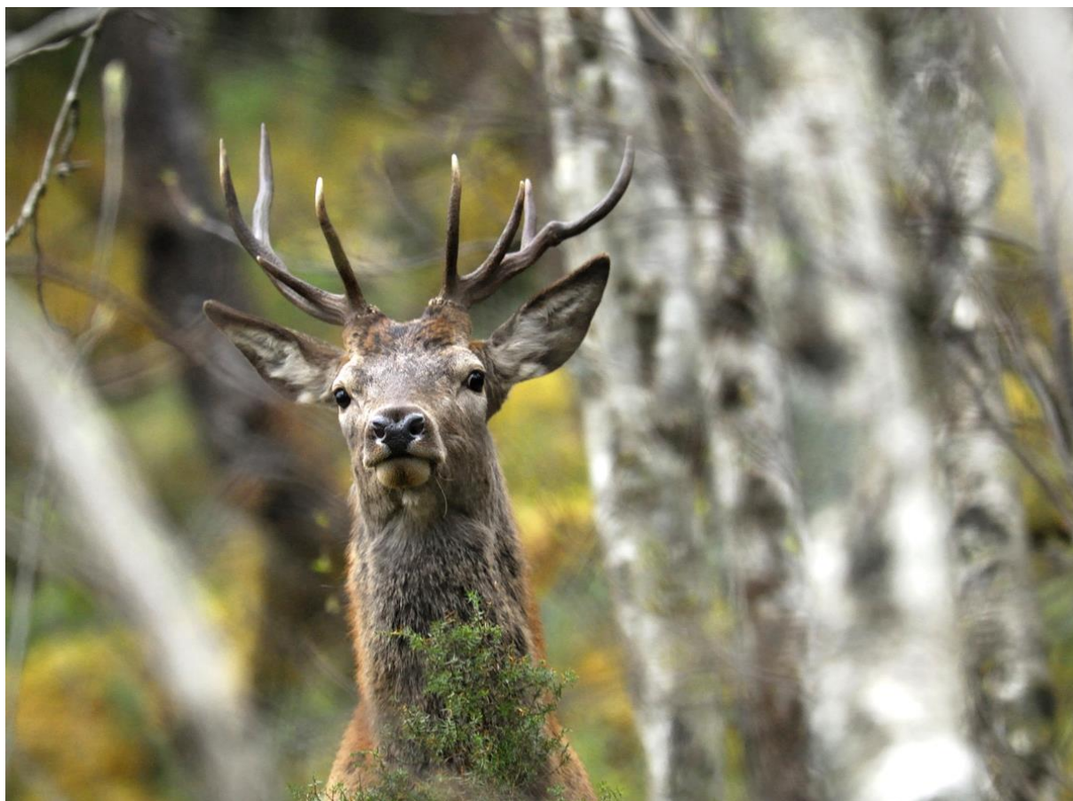
Hjortebukk.