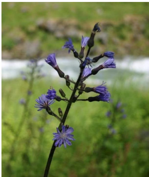
Turt, Cicerbita alpina .

Lov om naturens mangfold (naturmangfoldloven) og lov om jakt og fangst av vilt (viltloven) setter rammene for forvaltning av hjortevilt i Norge. Formålsbestemmelsen i viltloven, « Viltet og viltets leveområder skal forvaltes i samsvar med naturmangfoldloven og slik at naturens produktivitet og artsrikdom bevares », danner sammen med forvaltningsprinsippene i naturmangfoldloven (§§ 4-14) en solid basis og rettesnor for forvaltningen.