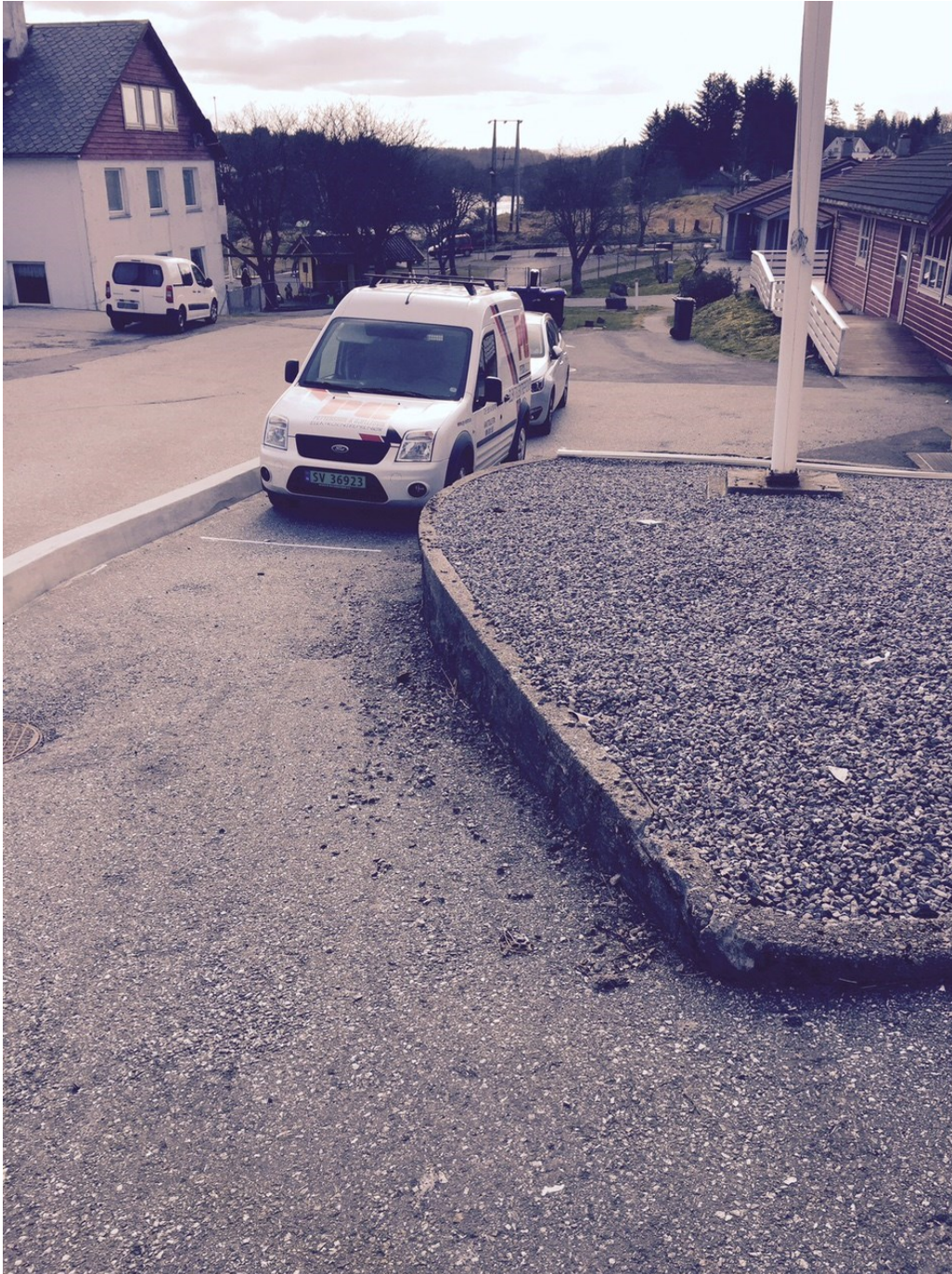
Foto 20.04.16: Grusa bed som hindrar gjennomkøyring. Parkerte bilar må rygge ut mot merka køyreretning.

Parkeringsplassen er ikkje opparbeid med gjennomkøyringspassasje. Eit grusa bed hindrar gjennomkøyring. Når bilane ikkje kan køyre gjennom parkeringsplassen vert det inn- og utkøyring mot den køyreretningen som er angitt med pilmerking. Bilene må rygge ut i den kommunal vegen, og det som opphavleg var eit trafikksikringstiltak førar i staden for til auka risiko.