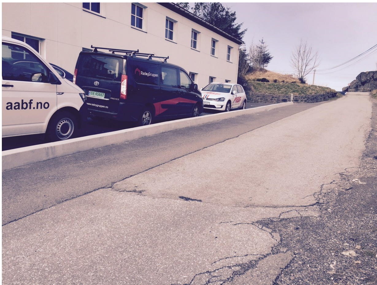
Foto 20.04.16: To bilar har køyrd inn mot merka køyreretning og må rygge ut igjen den kommunale vegen.