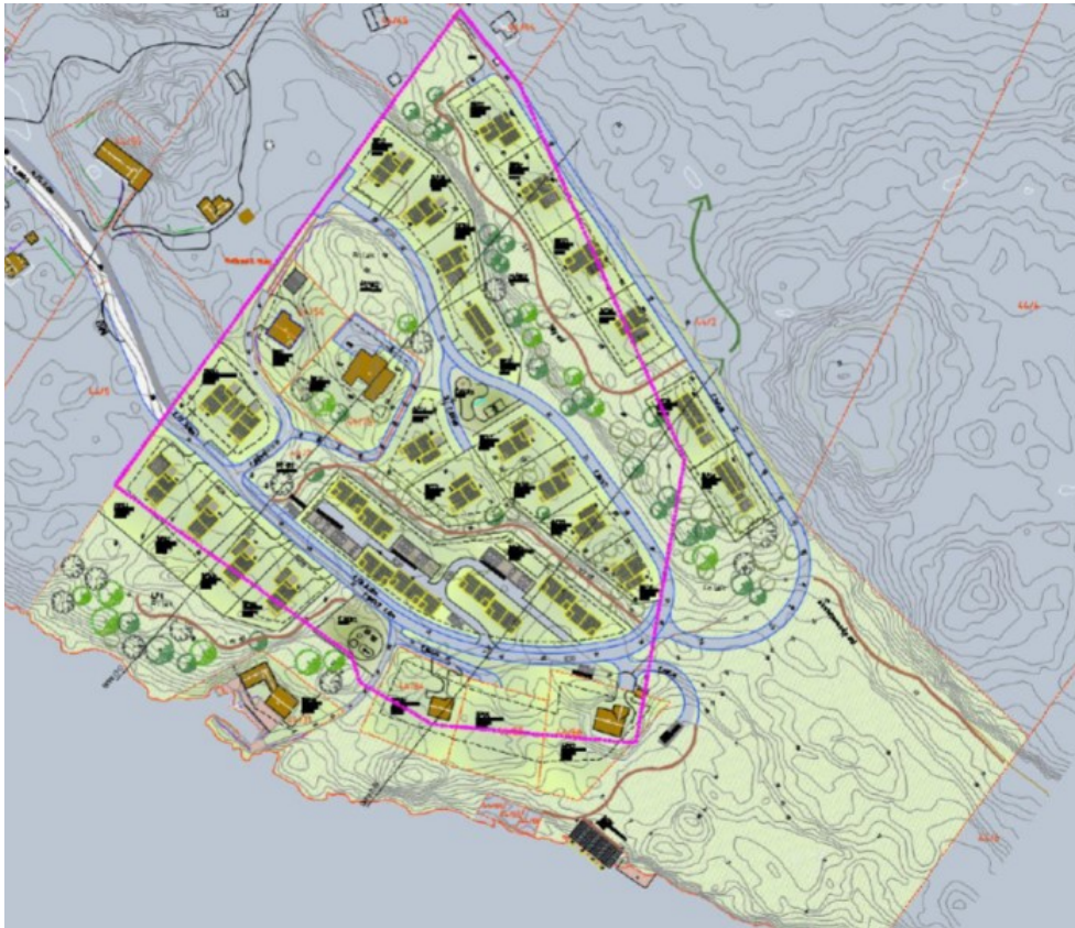
Revidert illustrasjonsplan 25.07.16 som viser føremålsgrænse frå Kommuneplan

Plangrensa avviker framleis frå føremålsgrænse for bustadområdet i kommuneplanen, men forslagsstiller har redusert byggeområdet i omfang slik at hovuddelen av tiltaka er plassert innafor føremålsgrænse i kommuneplan. Det er uproblematisk at reguleringsplanen tek med LNF området frå kommuneplanen, så lenge området vidareførast med LNF føremål i reguleringsplanen.