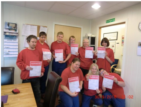
Kursbevis etter ferdig kurs

Utover dette har det vore ordinært tilsette på kurs i: