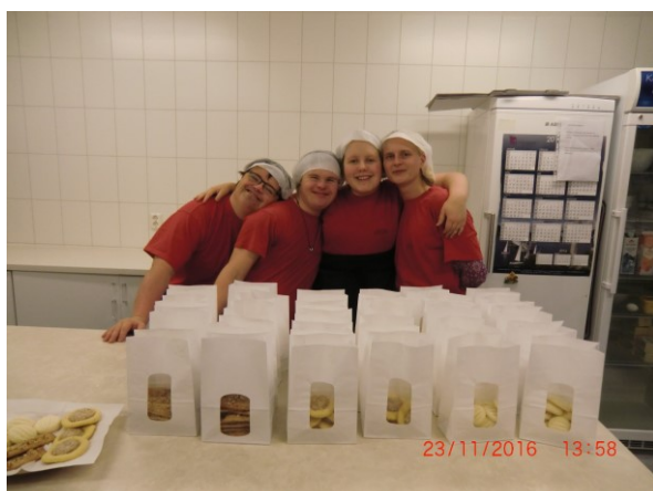
Julebaksten er i gang

Kjøkkenet vart frå januar 2016 opna att ein dag for veka. Frå august vart dette auka til to dagar for veka. I tillegg til lunsjtilbod for dei som jobbar på Aufera, er det produksjon av lefser, flatbrød, knekkebrød, kaker og diverse urteprodukt. Samarbeidet med busselskapet som kjører turar i Nordhordland vart tatt opp igjen då kjøkkenet starta oppatt.