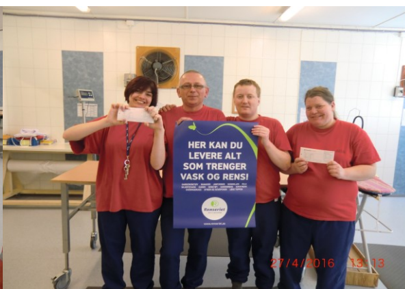
No kan du også få renseritenester hjå oss.