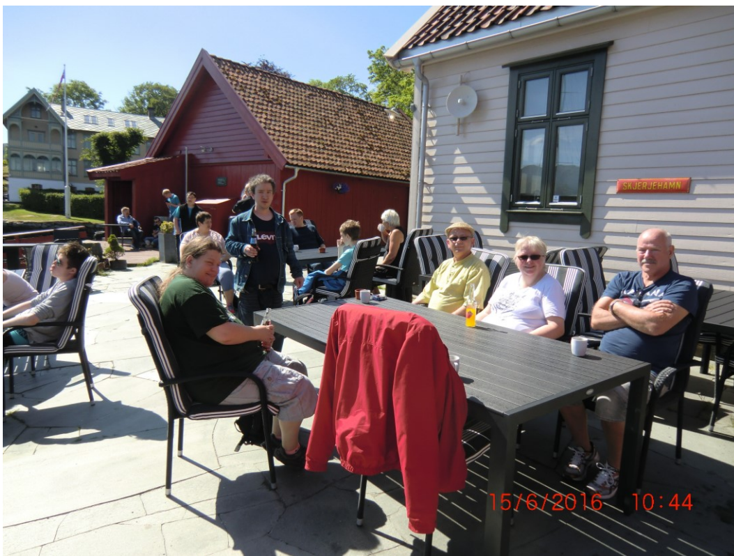
Hyggeleg samvær i solveggen i Skjerjemhamn

Medgang og motgang, Aufera opplver stolte eigarar og ikkje minst mennesker som er stolt over arbeidsplassen sin. Det fekk me stadfesta i spørjeundersøkinga som nett har vorte gjennomført. Alle på VTA, alle elevar, alle ordinært tilsette og sakshandsamarar på NAV-kontora har vore spurd. Me fekk svært gode tilbakemeldingar, så me har mykje å leva opp til for å halda det nivået.