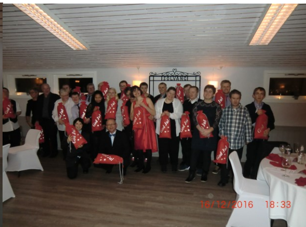
Og «hovudpersonane» på julebordet.