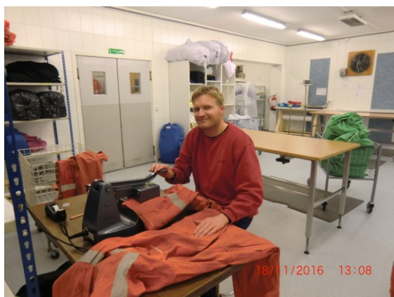
Harald sveiser kjeledressar

Verksemda har i mange år hatt eit samarbeid med ein del bibliotek i Nordhordaland. Me sorterer og fraktar bøk mellom biblioteka.