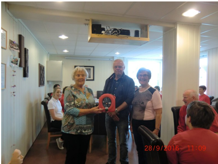
Representantar frå Radøy hjarte og lungelag med hjartestartar.