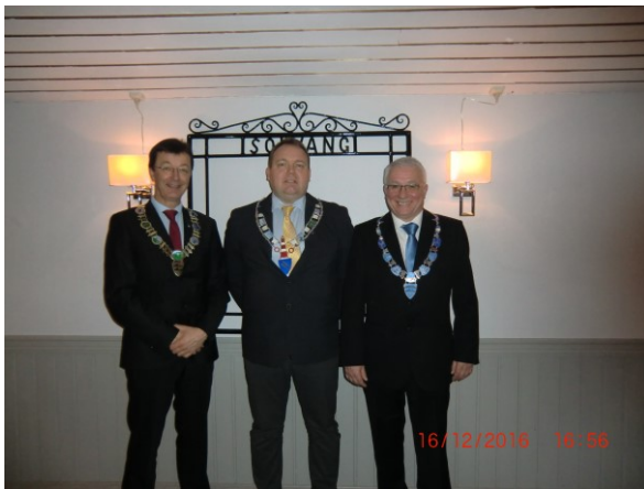
Staute representantar frå eigarane.