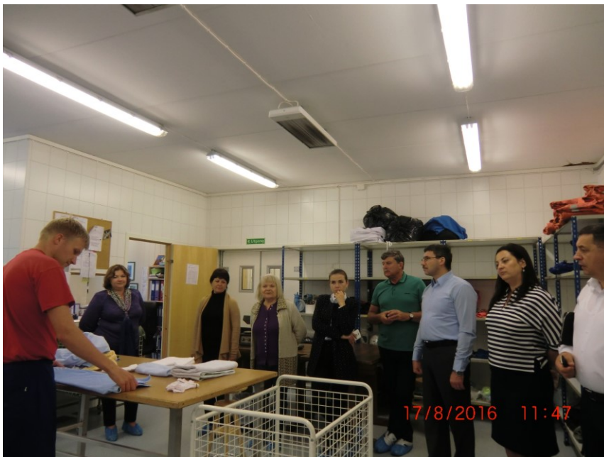
Delegasjonen frå Moldova får demonstrasjon av arbeidet på vaskeriet.

Omdømme til Aufera opplever me som godt. Me får svært mange gode tilbakemeldingar frå alle hald, både dei som jobbar her, familiane deira, kundar og andre samarbeidspartar. Tilbakemeldingar frå eigarane våre er me og godt nøgd med. Ikkje alle bedrifter kan skryta på seg at dei har tre ordførarar med seg kvart år på julebordet.