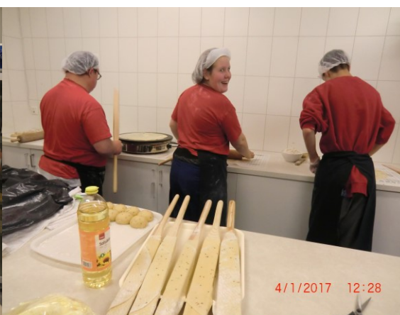
Det går unna på lefsene våre