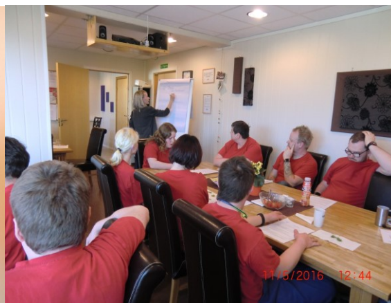
Kurs i organisasjonsutvikling