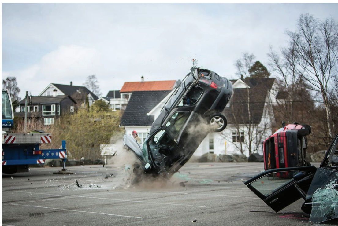
Frå trafikktryggleiksdagen for avgangsklassane i Nordhordland, på Folkehøgskulen i Meland

Kommunane Lindås og Austrheim fekk trafikksikringsprisen i 2013. Dette er midlar som kommunane sjølv kan bruka fritt til trafikksikringstiltak. Kommunane fekk prisen saman blant anna for det gode trafikksam arbeidet på tvers av kommunegrensa.