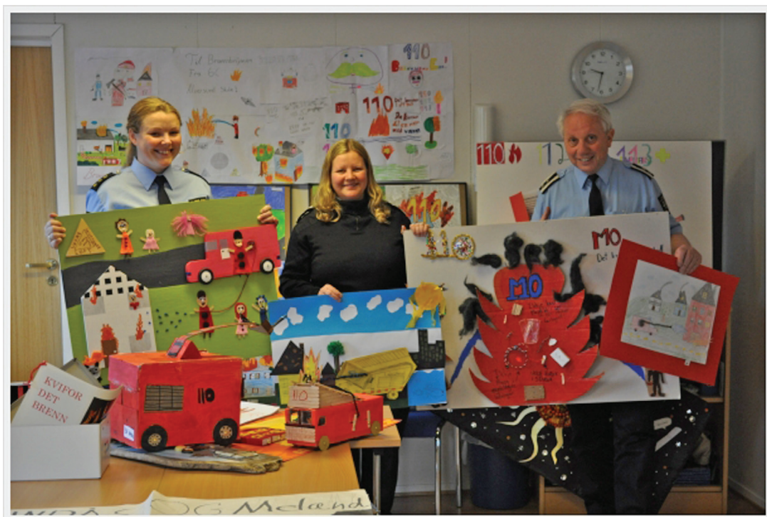
Juryen samla med nokre av bidraga som vart sendt inn

I år vant 6. trinn frå Rossland, Knarvik, Kløvheim, Mo og Ytre Solund skular.