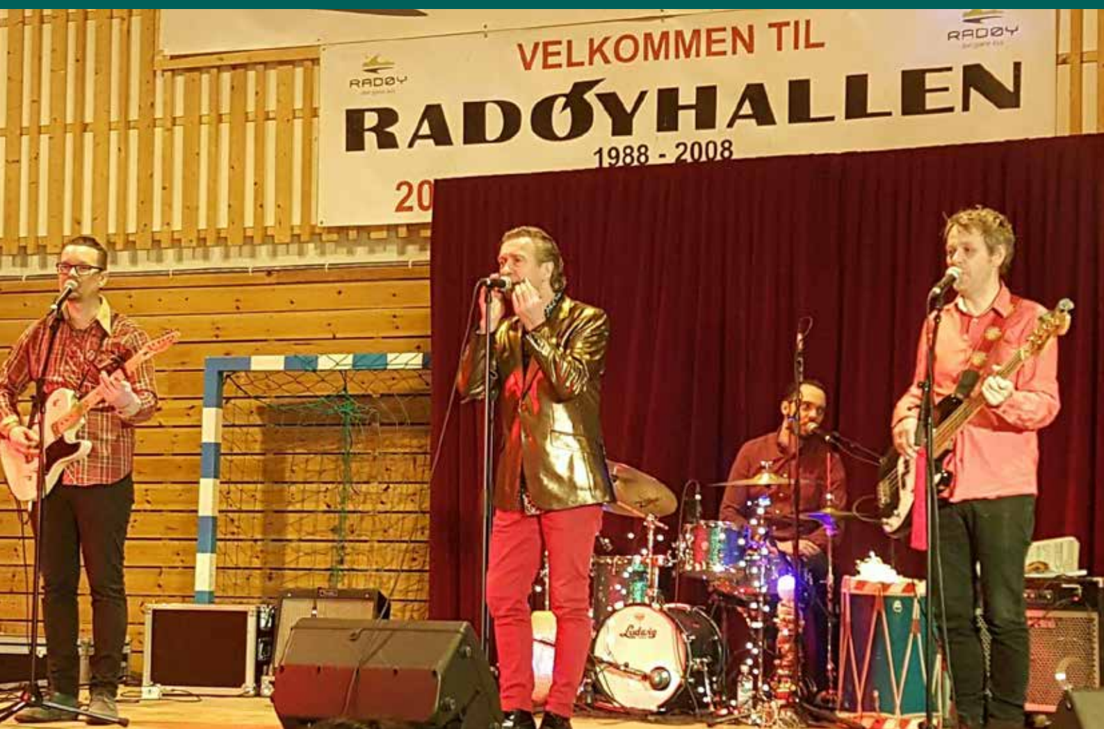
Good time Charlie underheldt på familiedag for heltar og skurkar i Radøyhallen

Informasjonsskriv frå kulturadministrasjonen i Radøy kommune