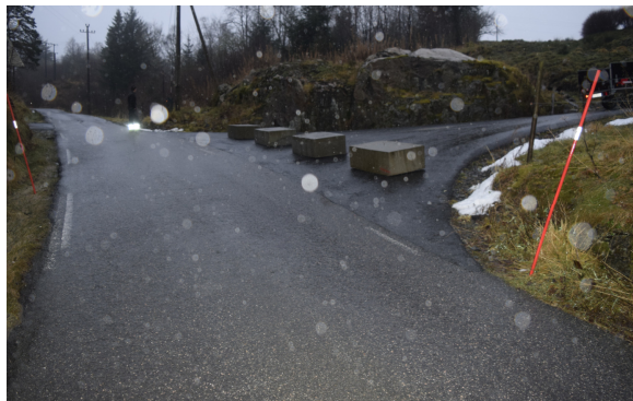
Foto tatt fra øst mot vest fra Grindheimsvegen