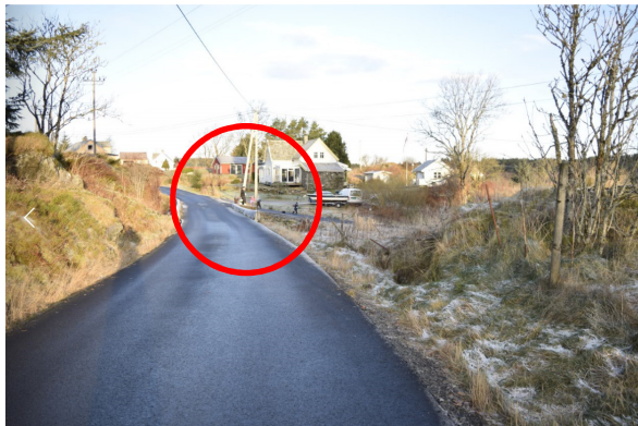
Fra Grindheimsvegen/sør mot avkjørsel