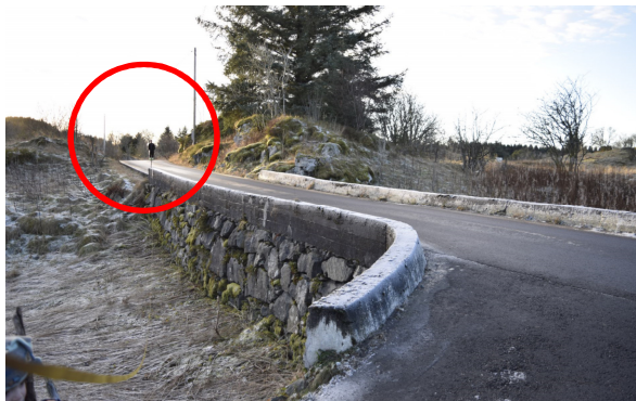
Fra avkjørsel mot sør/Grindheimsvegen