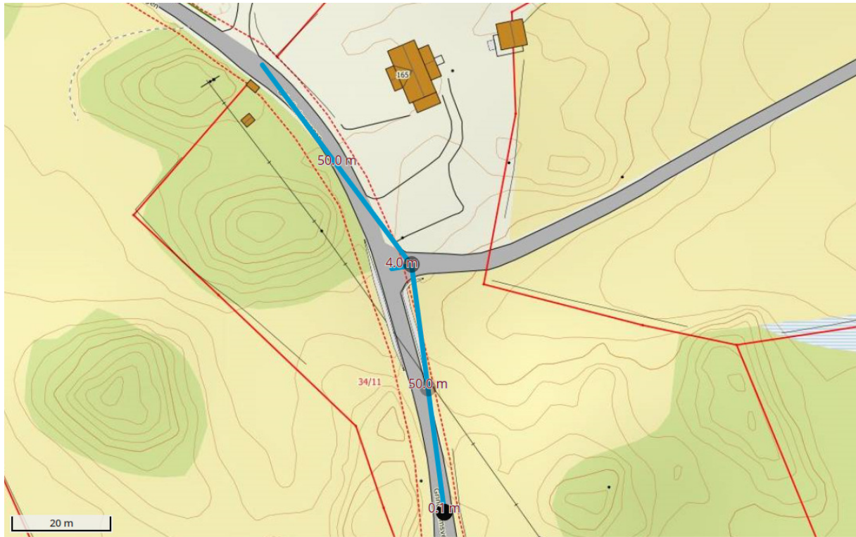
Utsnitt av nordhordlandskart

Tiltakshaver søker herved om utvidet midlertidig brukstillatelse for barnehagen.