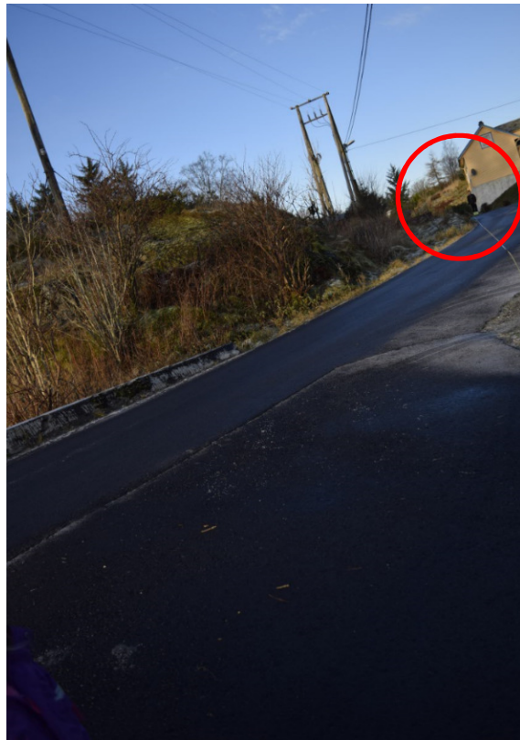
Fra avkjørsel mot nord/Grindheimsvegen