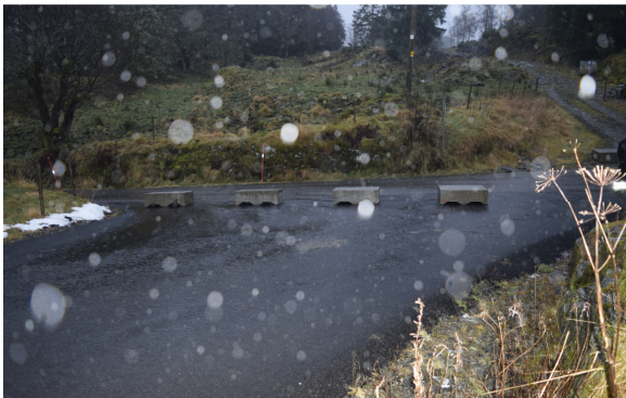
Foto fra gårdsvei mot sør/FV412 Grindheimsvegen