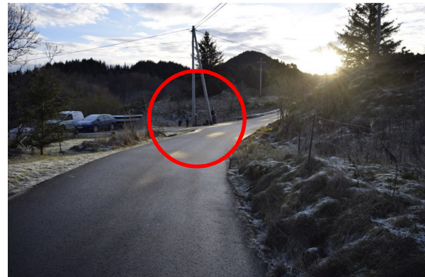
Fra Grindheimsvegen/nord mot avkjørsel