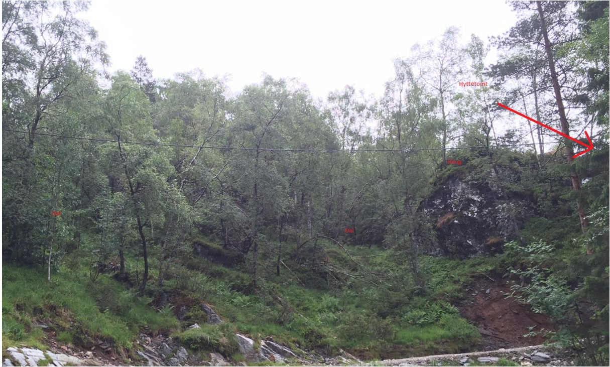
Figur 2 Bilde av dalane/haugen bak hytta