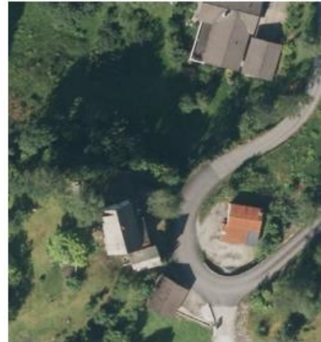
Fig.2: Gbnr 26/ 32,45. Eigedom er bebygd med bustadhus, der vegen skil huset frå garasjen.