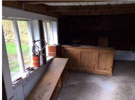
Innvendig – salslokale