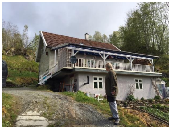
Inngjera terrasse – skjenkelokale