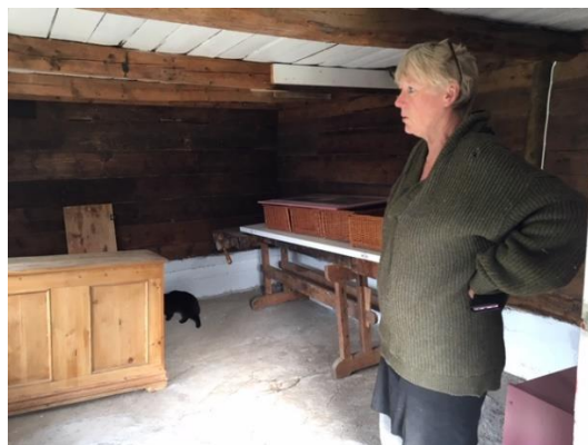
Innvendig – salslokale