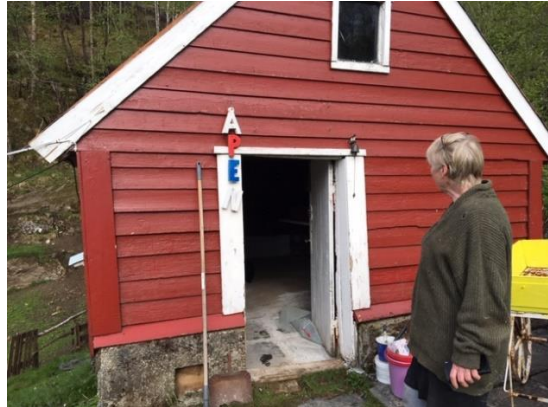
Gardsbutikk - salslokale

Samnanger kommune mottok 23.02.2019 søknad om sals- og skjenkeløyve frå Osteriet i Samnanger v/ Bente Getz. Salsløyvet skal nyttast i eige butikklokale på garden (sjå bilete under) og skjenkeløyvet skal nyttast ute på terrassen som er knytt til bustadhuset. (sjå bilete under). På sida av huset er ei eigen dør som skal nyttast til skjenking under arrangement på terrassen.