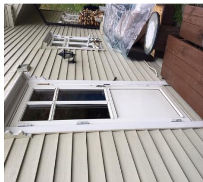
Dør – skjenkelokale