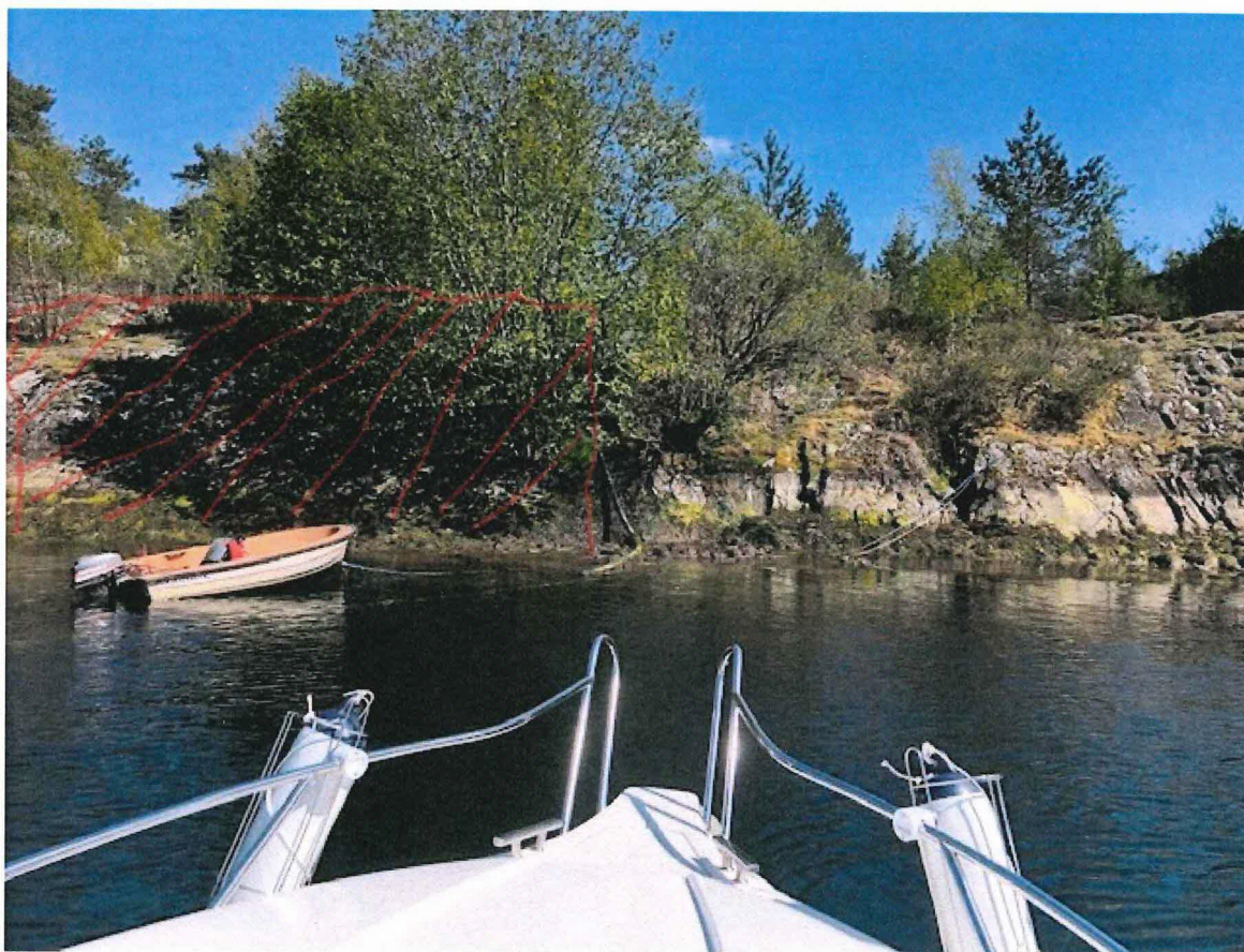
Tomten sett fra sjøsiden merket rødt , bratt fjellskrent, ikke dyrket mark, eller lett tilkomst i dag.