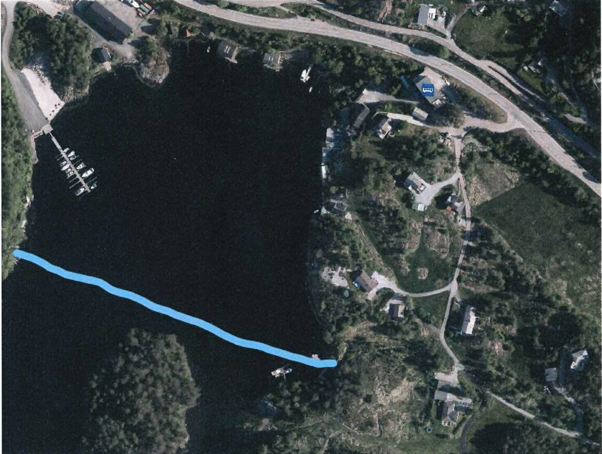
Oversikt bilde av vågen i dag, som dere ser er vårt tiltak ikke skjemmende i terrenget, og tomten ligger innfor blå stripe som er merket som småbåthavn i kommuneplan/reguleringsplan