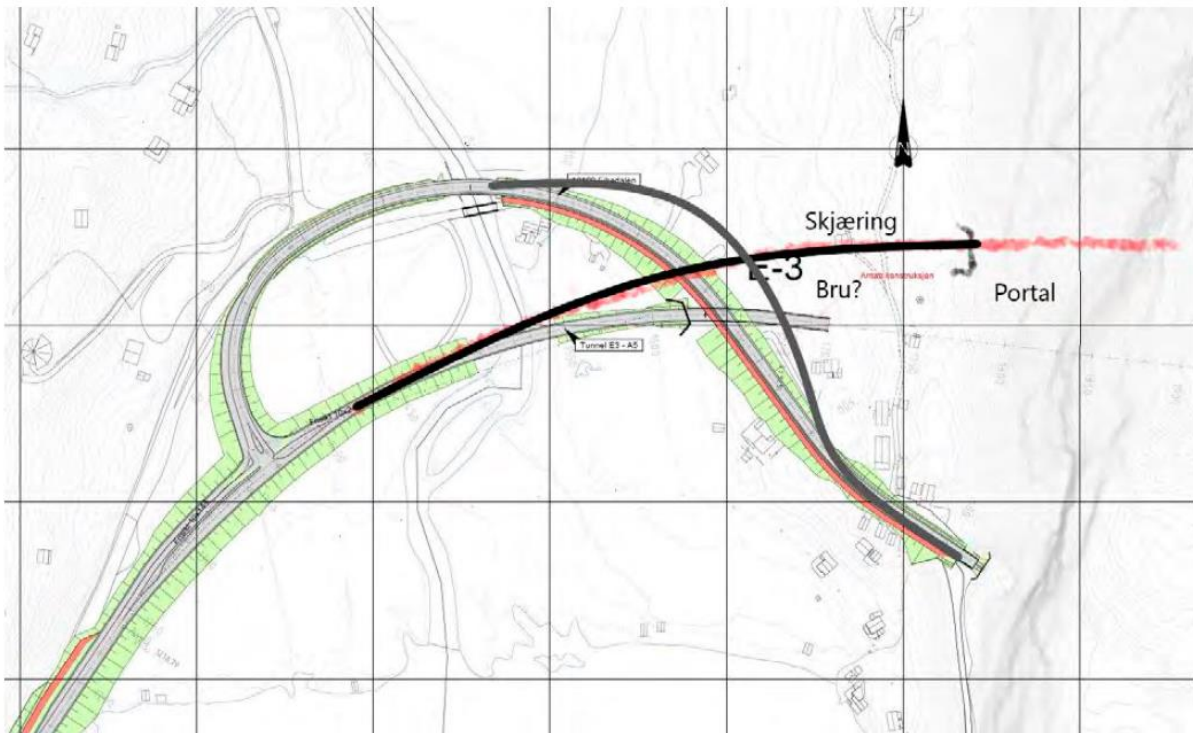
Figur 3: Endring av påhogg i Eikedalen. Svart linje viser alternativ plassering av ny veglinje for fv. 49. Lokalveg, vist med mørk grå linje, kan leggest på bru over ny fylkesveg i staden for over portal som planlagt i opprinneleg løysing.