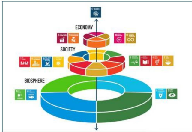
Figur 2. FNs bærekraftsmål organisert etter bærekraftmodellen som viser hvordan bærekraftmålene bør praktiseres for å ivareta natur.

Planprogrammet nevner at akvakulturplanen skal legge til rette for matproduksjon sett i sammenheng med klima, miljø og FNs bærekraftsmål. Det er likevel ikke nevnt noe videre om definisjonen til bærekraftmålene eller hvilke føringer bærekraftmålene gir, og målene er kun omtalt med to setninger under temaet «lokale føringer og rammer» på side 9 i programmet. Bærekraftmålene bør presenteres i planprogrammet og i akvakulturplanen i form av bærekraftmodellen til Stockholm Resilience Centre - “Sustainability Science for Biosphere Stewardship” - som angir en modell for hva bærekraft innebærer, og hvordan naturen bør ivaretas 10 . I bærekraftmodellen er klima, naturvern, biologisk mangfold og rent drikkevann grunnmuren som skaper forutsetningene for samfunnsutvikling, mens næringsinteressene er prioritert sist ( figur 2 ). En slik praktisering vil være i tråd med bærekraftmålene slik de benyttes av FN. Enhver plan som hevder at den skal fungere som et styringsverktøy med bærekraft som grunnmur, må presentere målene på denne måten, ellers vil de miljømessige formålene med akvakulturplanen være bortkastet. Bærekraftmålene ligger også til grunn for “Nasjonale forventninger til kommunal og regional planlegging 2019-2023”, jf. Plan- og bygningsloven § 6-1.